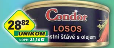
SIMANDL s.r.o., Losos ve vlastní šťávě 240g, obj.č.43186080