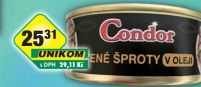
SIMANDL s.r.o., Šprot uzený v oleji 240g, obj.č.43186518