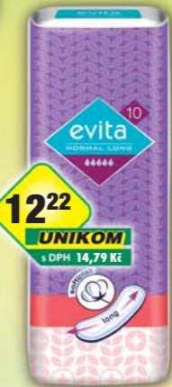
TZMO CZ s.r.o., Vložky Evita normal long/10ks, obj.č.57285800