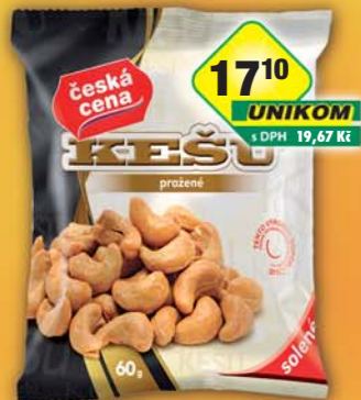
ČESKÁ CENA, Kešu solené 60g, obj.č.11984290