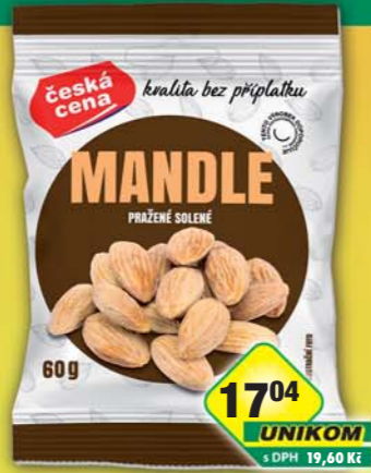
ČESKÁ CENA, Mandle pražené solené 60g, obj.č.11984352