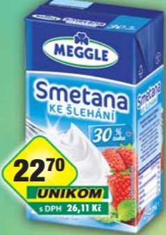
RAJO a.s., Smetana ke šlehaní 30% 250ml, obj.č.31221161