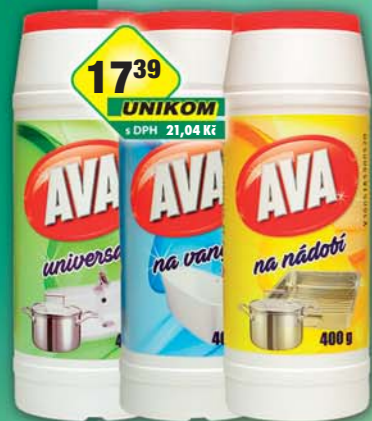
HLUBNA ch.v.d.Brno, Ava na nádobí, obj.č.58317101, na vany, obj.č.58800026, universal, obj.č.58553070, 400g