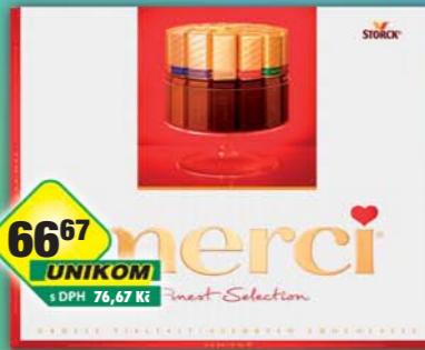
STORCK s.r.o., Merci klasik 250g, obj.č.13157102