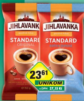
TCHIBO s.r.o., Jihlavanka Standard, obj.č.15107323, Standard Extra jemná, obj.č.15107313, 150g