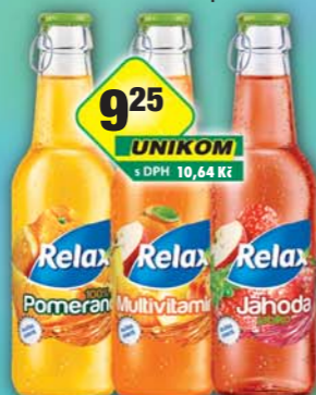
MASPEX s.r.o., Relax víčko jahoda, obj.č.45119702, multivitamin, obj.č.45119709, pomeranč, obj.č.45119712, 0,25l