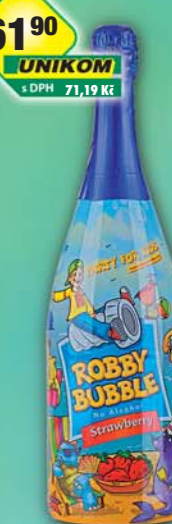
UNIKOM a.s., Robby Bubble jahoda 1,5l, obj.č.52138191