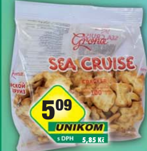
FS IMPORT - EXPORT, Krekry Sea cruise sůl 100g, obj.č.11153115