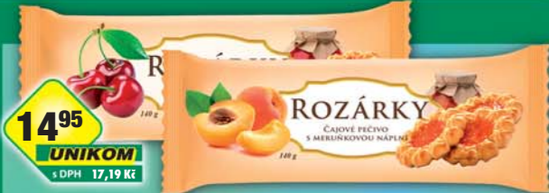
FAMMILKY s.r.o., Rozárky meruňka, obj.č.10165749, třešeň, obj.č.10165753, 140g