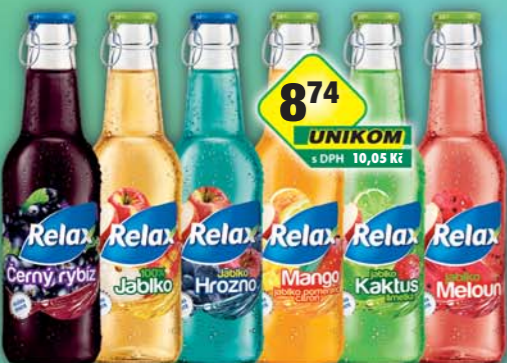
MASPEX s.r.o., Relax víčko černý rybič, obj.č.45119565, jablko, obj.č.45119700, jablko/hrozno, obj.č.45119699, kaktus, obj.č.45119703, mango, obj.č.45119706, meloun, obj.č.45119708, 0,25l