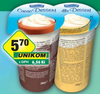
EHRMANN s.r.o., Kakaový dessert Milfrisch, obj.č.31847780, Vanilkový dessert Milfrisch, obj.č.31847785, 200g