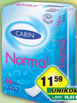
FIDE s.r.o., Vložky Carin normal 16ks, obj.č.57288148