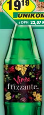
KOFOLA a.s., Vinea Frizzante 1l, obj.č.45115930