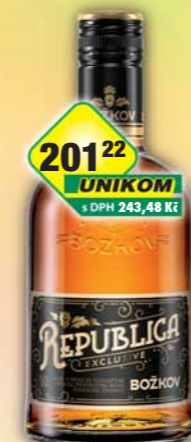
STOCK Plzeň - Božkov s.r.o., Božkov Republica Exclusive 38% 0,5l, obj.č.53126081