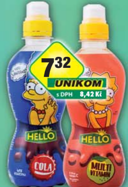
LINEA NIVNICE a.s., Hello Simpson's cola, obj.č.48124215, multivitamin, obj.č.48124243, 330ml