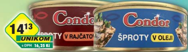
SIMANDL s.r.o., Šprot v oleji, obj.č.43186516, v rajčatové omáče, obj.č.43186517, 240g