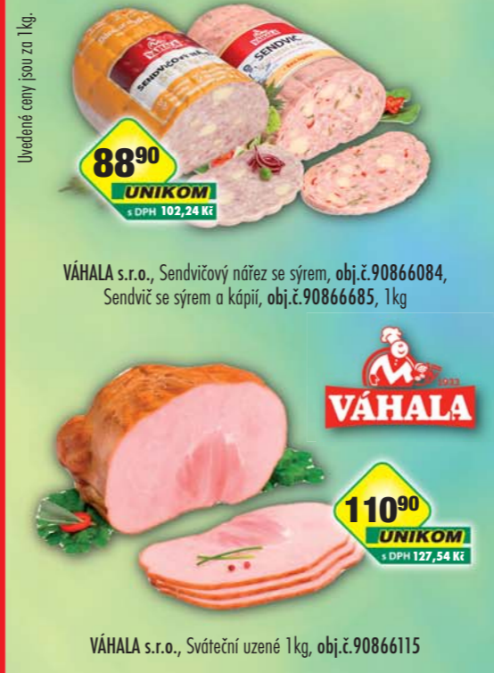
VÁHALA s.r.o., Sendvičový nářez se sýrem, obj.č.90866084, Sendvič se sýrem a kápií, obj.č.90866685, 1kg