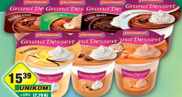
EHRMANN s.r.o., Grand dessert Schoco straciatella, obj.č.31847852, Double choc, obj.č.31847843, Double toffee, obj.č.31847837, Double nut, obj.č.31847846, Choc noir, obj.č.31847853, Café au Lait, obj.č.31847838, Vanilka se šlehačkou, obj.č.31847847, 190g