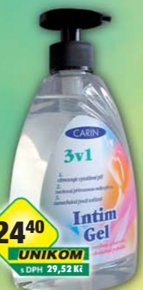
FIDE s.r.o., Intim gel 3v1 500ml, obj.č.56288050