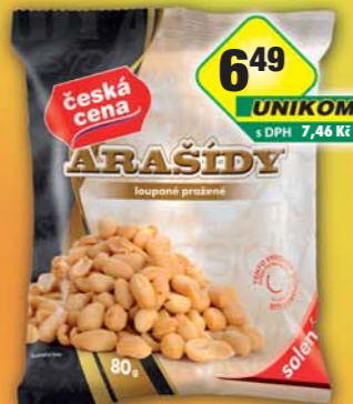
ČESKÁ CENA, Arašidy solené 80g, obj.č.11984090