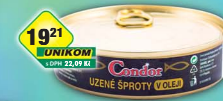
SIMANDL s.r.o., Šprot uzený v oleji 160g, obj.č.43186510