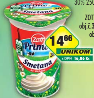
ZOTT s.r.o., Smetana ke šlehaní 30% 200g, obj.č.31775705