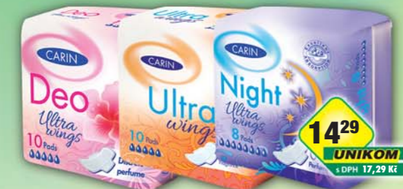
FIDE s.r.o., Vložky Carin deo ultra wings 10ks, obj.č.57288142, night ultra wings 8ks, obj.č.57288144, ultra wings singlet 10ks, obj.č.57288152