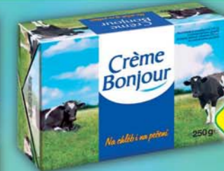
UPFIELD CR s.r.o., Crème Bonjour 250g, obj.č.33110094