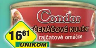
SIMANDL s.r.o., Kuličky pečenáčové 240g, obj.č.43186070