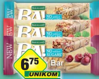
FS IMPORT - EXPORT, Mysli tyčinka BA! Jahoda quinoa, obj.č.21153405, Kokos chia, obj.č.21153406, Višeň, obj.č.21153450, 30g