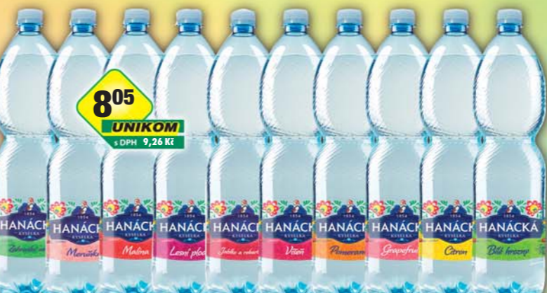
PODĚBRADKA a.s., Hanáček kyselka bílé hroznové, obj.č.45246205, citrón, obj.č.45246103, grep, obj.č.45246118, jablko rebarbora, obj.č.45246201, lesní plody, obj.č.45246130, malina, obj.č.45246133, meruňka, obj.č.45246140, pomeranč, obj.č.45246139, višňe, obj.č.45246159, zahradní směs, obj.č.45116283, 1,5l