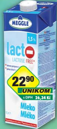
RAJO a.s., Mléko Lacto free 1,5% 1l, obj.č.31221930