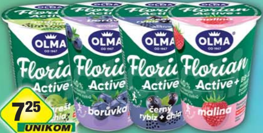
OLMA a.s., Jogurt Florian angršt s chia, obj.č.31697972, černý rybíz s chia, obj.č.31697971, borůvka, obj.č.31697970, malina, obj.č.31697972, mix, obj.č.31697973, 145g