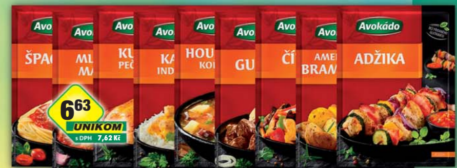
PĚKNÝ - UNIMEX, Adžika 30g, obj.č.22151116, Americké brambory 35g, obj.č.22151117, Čina 32g, obj.č.22151101, Guláš 31g, obj.č.22151138, Houbové 30g, obj.č.22151145, Kari indie 25g, obj.č.22151153, Kuře pečené 30g, obj.č.22151828, Mletá masa 32g, obj.č.22151173, Špagety 27g, obj.č.22151231