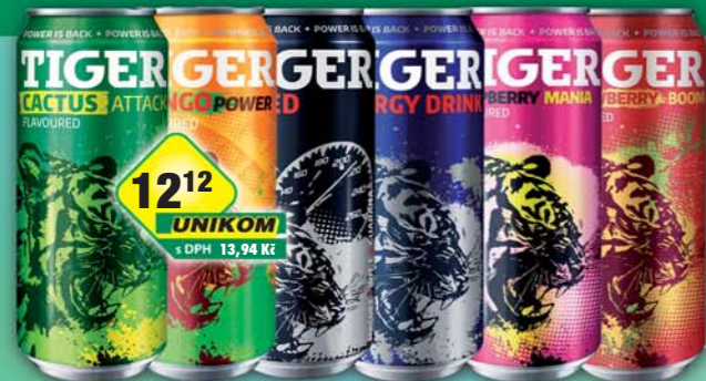
MASPEX s.r.o., Tiger Classic, obj.č.48119602, Jahoda, obj.č.48119591, Kaktus, obj.č.48119486, Malina, obj.č.48119484, Mango, obj.č.48119474, Speed, obj.č.48119483, 500ml