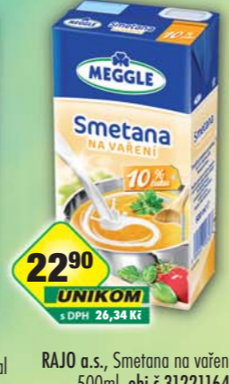
RAJO a.s., Smetana na vaření 10% 500ml, obj.č.31221164