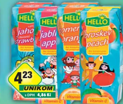
LINEA NIVNICE a.s., Hello broskev, obj.č.48124116, jablko, obj.č.48124172, jahoda, obj.č.48124180, pomeranč, obj.č.48124211, 250ml