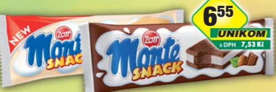
ZOTT s.r.o., Snack Monte, obj.č.31775740, Monte white, obj.č.31775744, 29g