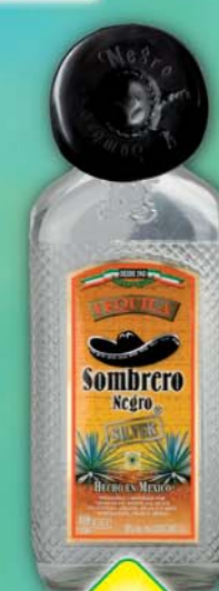
UNIKOM a.s., Tequila Sombbrero silver 38% 1l, obj.č.53126483