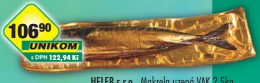
HELEB s.r.o., Makrela uzzená VAK 2,5kg, obj.č.39385178, *Cena za 1kg.