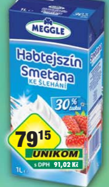
RAJO a.s., Smetana ke šlehaní 30% 1l, obj.č.65221105