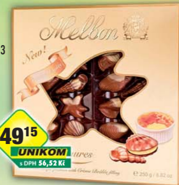
TREBORSWEETS s.r.o., Plody moře 250g, obj.č.13929410