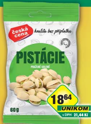
ČESKÁ CENA, Pistácie 60g, obj.č.11984651