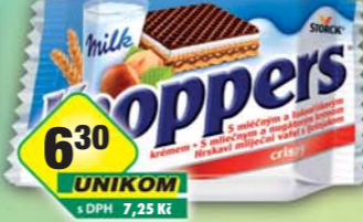
STORCK s.r.o., Knoppers 25g, obj.č.10157101