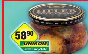
HELEB s.r.o., Kuličky sýrové borevné 250g, obj.č.31842100