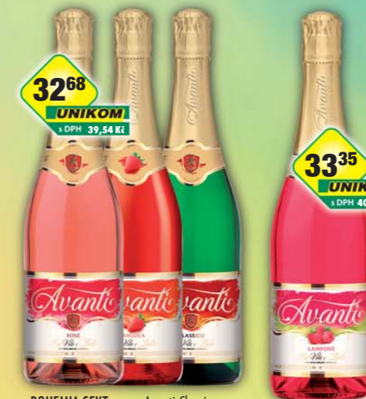
BOHEMIA SEKT s.r.o., Avanti Classico, obj.č.52293101, Fragola, obj.č.52478120, Rosse, obj.č.53318113, 0,75l