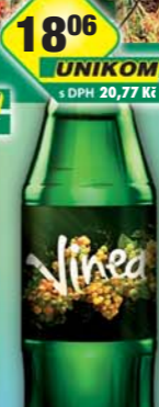
KOFOLA a.s., Vinea bílá 1l, obj.č.45115927