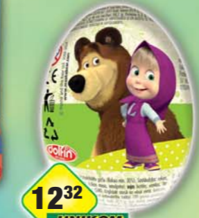
FS IMPORT - EXPORT, Vajičko Masha medvěď 20g, obj.č.12153090