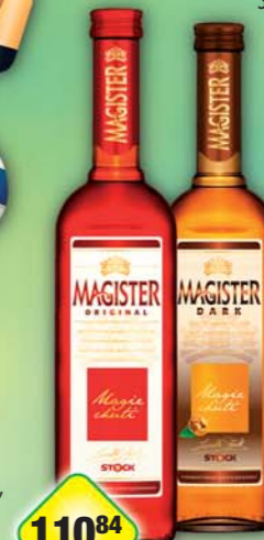
STOCK Plzeň - Božkov s.r.o., Magister dark 22%, obj.č.53126195, original 22%, obj.č.53126840, 0,5l