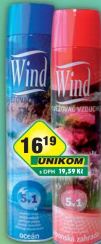
HLUBNA ch.v.d.Brno, Osvěžovač vzduchu Wind Japonská zahrada, obj.č.58553482, Wind Ocean, obj.č.58553471, 300ml