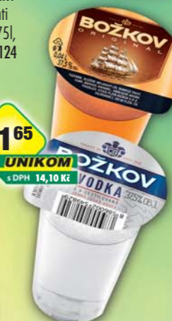
STOCK Plzeň - Božkov s.r.o., Božkov Original 37,5%, obj.č.53126261, Vodka 37,5%, obj.č.53126342, 0,04l