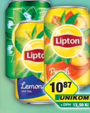
KMV BEV CZ s.r.o., Lipton green, obj.č.45170496, lemon, obj.č.45170495, peach, obj.č.45170494, 0,33l