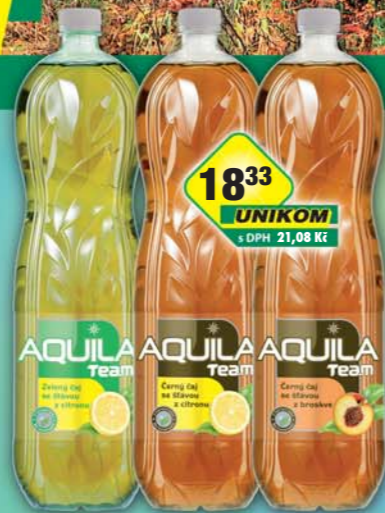
MATTONI 1873 a.s., Aquila čaj bruskev, obj.č.45116174, citron, obj.č.45116178, zelený citron, obj.č.45116184, 1,5l