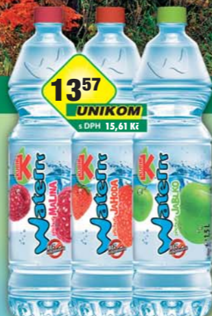
MASPEX s.r.o., Kubik Water Jablko, obj.č.45119353, Jahoda, obj.č.45119156, Malina, obj.č.45119155, 1,5l