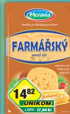
MORAVIA LACTO a.s., Sýr Farmářský plátky 30% 100g, obj.č.31704582