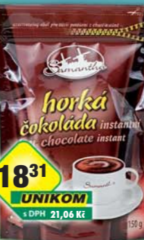
SIMANDL s.r.o., Čokoláda horká Samantha 150g, obj.č.16186149