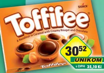
STORCK s.r.o., Toffifee 125g, obj.č.13157117