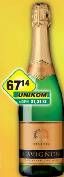
ČESKÁ CENA, Cavignon demi sec 0,75l, obj.č.52971100