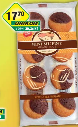
ČESKÁ CENA, Muffini mini mramor 180g, obj.č.10707470