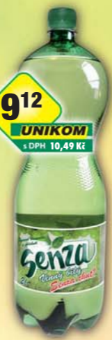
FONTEA a.s., Senza vinný bílý 2l, obj.č.45119189