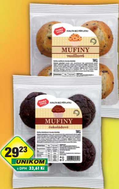
ČESKÁ CENA, Muffini čokoláda, obj.č.10707582, vanilka, obj.č.10707581, 300g