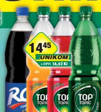
KOFOLA a.s., RC Cola, obj.č.45115294, Top Topic hrozen, obj.č.45115310, malina, obj.č.45115855, pomeranč, obj.č.45115870, 1,5l