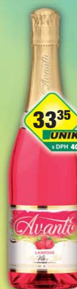
BOHEMIA SEKT s.r.o., Avanti Lampone 0,75l, obj.č.52478124