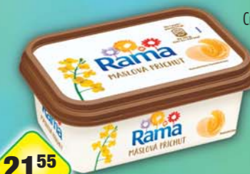
UPFIELD CR s.r.o., Rama maslová 250g, obj.č.33110249