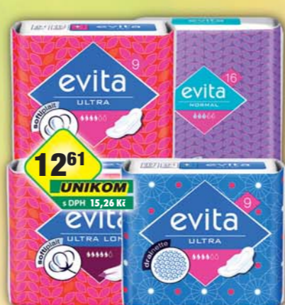
TZMO CZ s.r.o., Vložky Evita normal/16ks, obj.č.57285840, ultra drainette/9ks, obj.č.57285880, ultra long softplait/8ks, obj.č.57285900, ultra softplait/9ks, obj.č.57285890