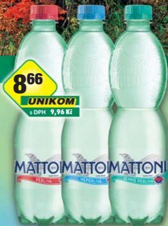
MATTONI 1873 a.s., Mattoni jemně perlivá, obj.č.45116469, neperlivá, obj.č.45116479, přírodní, obj.č.45116501, 0,5l