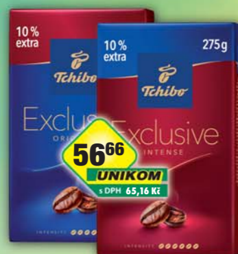
TCHIBO s.r.o., Exclusive 250g +10%, obj.č.15107804, Exclusive Intense 250g +10%, obj.č.15107805