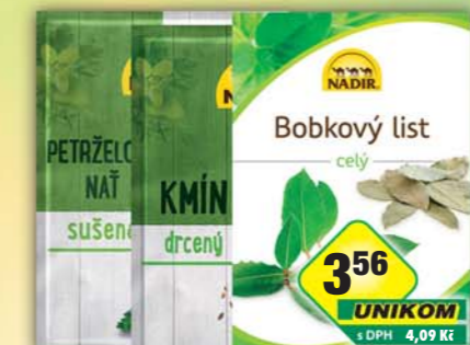
PĚKNÝ - UNIMEX, Bobkový list 5g, obj.č.22151670, Kmin drcený 25g, obj.č.22151695, Petrzela naf 6g, obj.č.22151868