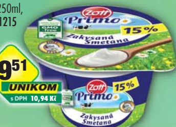
ZOTT s.r.o., Smetana zakysaná 15% 180g, obj.č.31775725