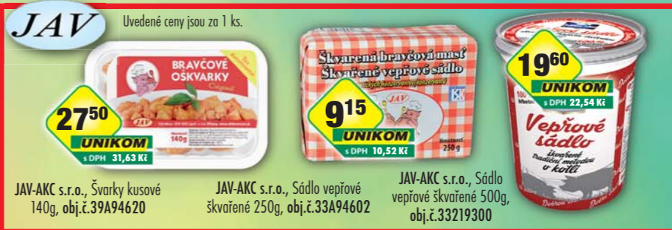
JAV-AKC s.r.o., Švarky kusové 140g, obj.č.39A94620