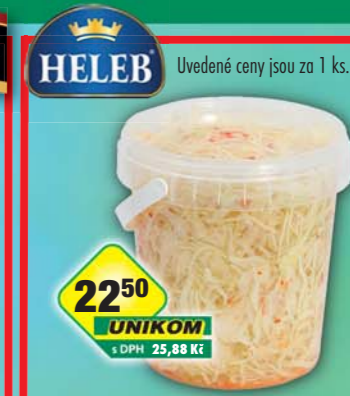
HELEB s.r.o., Salát zelený pikant 800g, obj.č.39842581