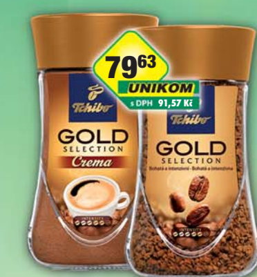
TCHIBO s.r.o., Gold Selection instant 200g, obj.č.15107500, instant Crema 180g, obj.č.15107525