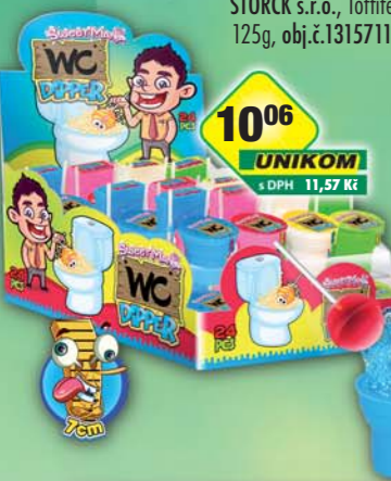
TREBORSWEETS s.r.o., WC Dipper s práškem+2 lizátka 15g, obj.č.14929633