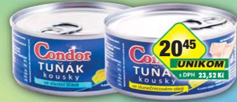
SIMANDL s.r.o., Tuňák kousky slunečnicový olej, obj.č.43186580, vlastní šťáva, obj.č.43186600, 170g