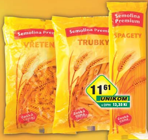
ČESKÁ CENA, Těstoviny semolinové špagety, obj.č.25146350, trubky, obj.č.25146370, vřetena, obj.č.25146387, 400g