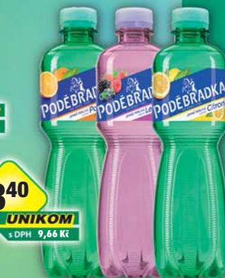
PODĚBRADKA a.s., Poděbradka citrón, obj.č.45117121, lesní plody, obj.č.45117141, pomeranč, obj.č.45117153, 0,5l