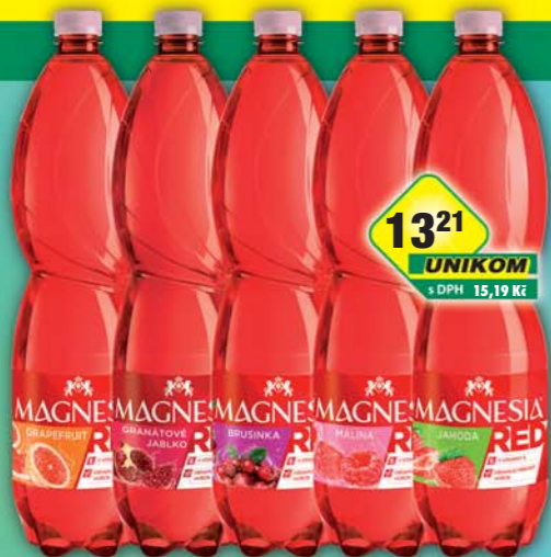
MATTONI 1873 a.s., Magnesia Red brusinka, obj.č.45116274, granátové jablko, obj.č.45116316, grep, obj.č.45116311, jahoda, obj.č.45116312, malina, obj.č.45116315, 1,5l