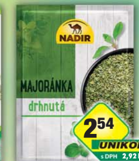
PĚKNÝ - UNIMEX, Majoránka 8g, obj.č.22151683