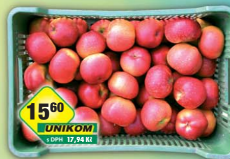
CZ FRUIT, obdobyvé družstvo, Jablka červená 85+ 1kg, obj.č.68397123