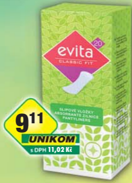
TZMO CZ s.r.o., Vložky Evita Classic fit/20ks, obj.č.57285790