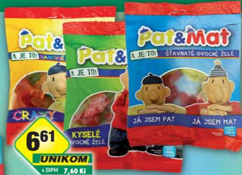
FS IMPORT - EXPORT, Pat Mat crazy, obj.č.14153452, kyselá, obj.č.14153451, ovocná, obj.č.14153450, 80g