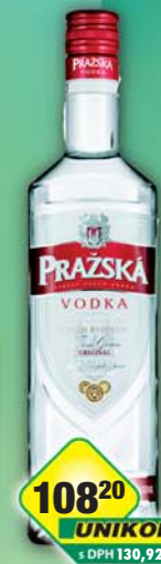
STOCK Plzeň - Božkov s.r.o., Vodka Prazská 37,5% 0,5l, obj.č.53478740