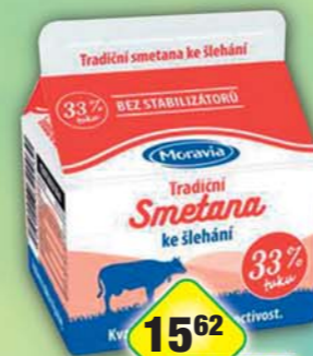
MORAVIA LACTO a.s., Smetana ke šlehaní 33% 250ml, obj.č.31704510