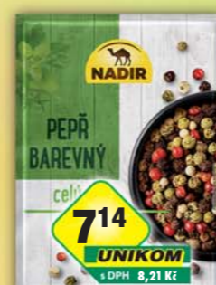
PĚKNÝ - UNIMEX, Pepř barevný celý 14g, obj.č.22151900