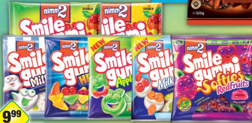
STORCK s.r.o., Nimm2 SG apple, obj.č.14157150, fruits, obj.č.14157173, heroes, obj.č.14157175, milk buddies, obj.č.14157180, milk ghosts, obj.č.14157156, 90g, Nimm2 SG kyselá, obj.č.14157116, ovocná, obj.č.14157115, 100g