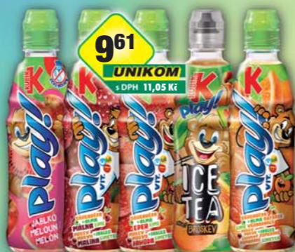
MASPEX s.r.o., Kubik Play červený pomeranč, obj.č.48119192, Ice Tea broskev, obj.č.48119187, jahoda, obj.č.48119190, malina, obj.č.48119191, Watermelon, obj.č.48119181, 0,4l