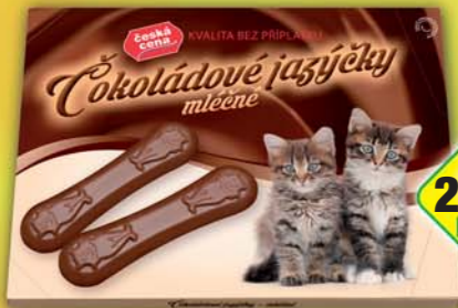
ČESKÁ CENA, Čokoládové jazýčky 100g, obj.č.12336111