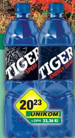
MASPEX s.r.o., Tiger Classic, obj.č.48119470, Speed, obj.č.48119608, 900ml