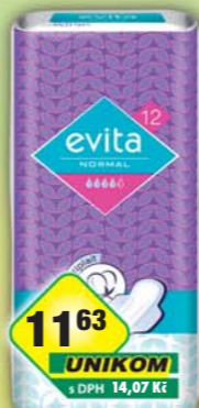
TZMO CZ s.r.o., Vložky Evita normal wings/12ks, obj.č.57283266