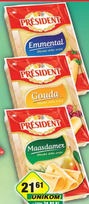
LACTALIS s.r.o., Plátkový sýr Emmentál, obj.č.31584630, Gouda, obj.č.31584632, Maasdamer, obj.č.31584629, 100g