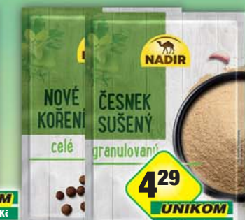
PĚKNÝ - UNIMEX, Česnek 20g, obj.č.22151671, Nové koření celé 15g, obj.č.22151867