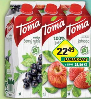
KMV BEV CZ s.r.o., Toma Černý rybíz, obj.č.47170129, Jablko 100%, obj.č.47170161, Jahoda, obj.č.47170163, 1l