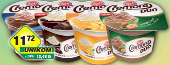
ZOTT s.r.o., Cremore Duo čokoláda, obj.č.31775802, dark čokoláda, obj.č.31775801, nut, obj.č.31775800, vanilka, obj.č.31775799, 190g