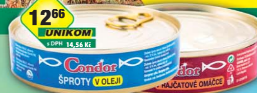
SIMANDL s.r.o., Šprot v oleji, obj.č.43186500, v rajčatové omáče, obj.č.43186515, 160g