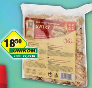
UNIKOM a.s., Podpalovač eko svítky 16ks, obj.č.60A13488