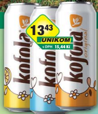
KOFOLA a.s., Kofola bez cukru, obj.č.45115132, citrus, obj.č.45115136, original, obj.č.45115159, 0,5l