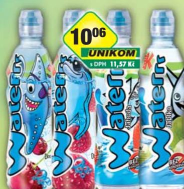
MASPEX s.r.o., Kubik Waterri jablko, obj.č.45119368, jahoda, obj.č.45119355, malina, obj.č.45119358, višně, obj.č.45119395, 0,5l