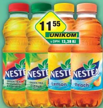
MASPEX s.r.o., Nestea Black tea Lemon, obj.č.45119119, Peach, obj.č.45119121, Nestea Green tea Citrus, obj.č.45119112, jahody&aloe vera, obj.č.45119124, 0,5l