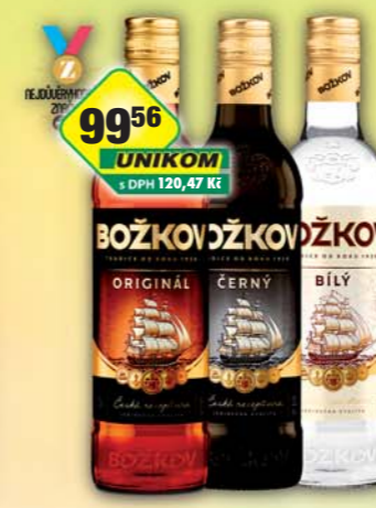
STOCK Plzeň - Božkov s.r.o., Božkov Bílý 30%, obj.č.53126085, Černý 33%, obj.č.53126089, Original 37,5%, obj.č.53126265, 0,5l