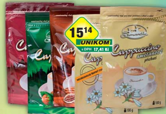
SIMANDL s.r.o., Cappuccino classic, obj.č.16186103, čokoláda, obj.č.16186107, neslazená smetana, obj.č.16186114, ořech, obj.č.16186109, smetana, obj.č.16186111, 100g