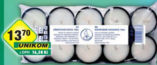
UNIKOM a.s., Svíčka iluminační 10x25g, obj.č.55278118