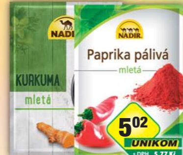
PĚKNÝ - UNIMEX, Kurkuma 20g, obj.č.22151889, Paprika pálivá 25g, obj.č.22151696