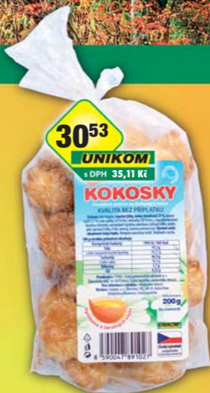
ČESKÁ CENA, Kokosky 200g, obj.č.10397550