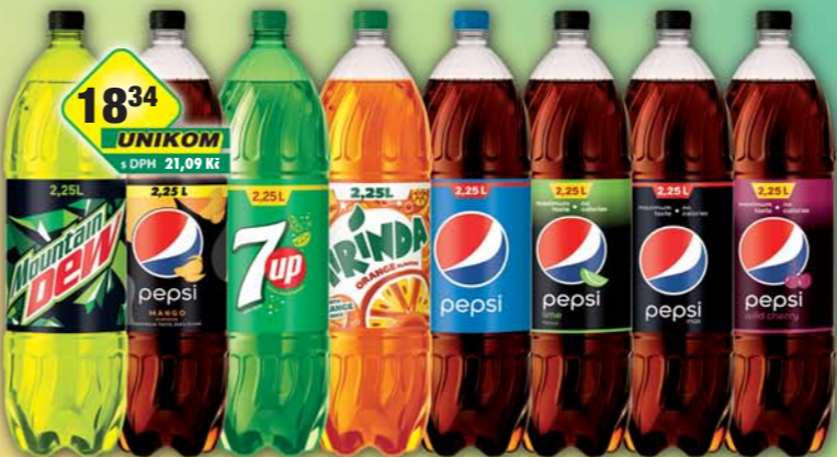
KMV BEV CZ s.r.o., 7UP, obj.č.45170950, Mirinda Orange, obj.č.45170539, Mountain Dew, obj.č.45170780, Pepsi, obj.č.45170325, Pepsi Lime, obj.č.45170295, Pepsi Mango, obj.č.45170892, Pepsi MAX bez kalorií, obj.č.45170885, Pepsi Wild cherry, obj.č.45170888, 2,25l