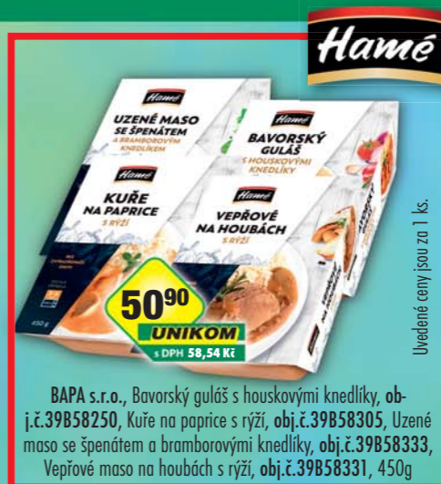
BAPA s.r.o., Bavorský guláš s houskovými knedlíky, obj.č.39B58250, Kuře na paprice s rýží, obj.č.39B58305, Uzené maso se špenátem a bramborovými knedlíky, obj.č.39B58333, Vepřové maso na houbách s rýží, obj.č.39B58331, 450g