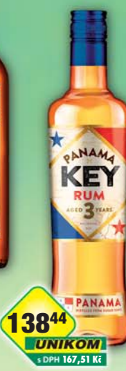
STOCK Plzeň - Božkov s.r.o., Rum Key Panama 3YO 38% 0,5l, obj.č.53126767