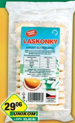
ČESKÁ CENA, Laskonky malé 120g, obj.č.10397600