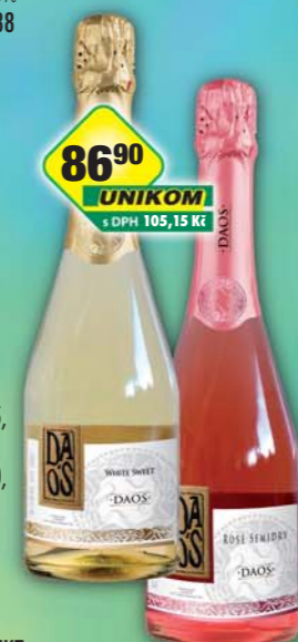
UNIKOM a.s., Sekt Daos rosé, obj.č.52391545, Daos white, obj.č.52391550, 0,75l