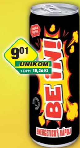
ČESKÁ CENA, BE IN! energetický nápoj 500ml, obj.č.48817401