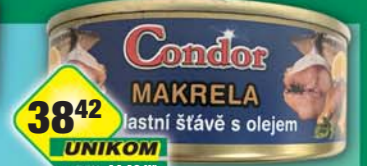
SIMANDL s.r.o., Makrela vlastní šťáva 240g, obj.č.43186100