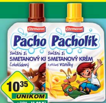
EHRMANN s.r.o., Pacholik vanilka, obj.č.31847862, čokoláda, obj.č.31847861, 70g