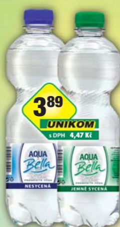
FONTEA a.s., Aqua Bella jemně perlivá, obj.č.45245090, neperlivá, obj.č.45245095, 0,5l