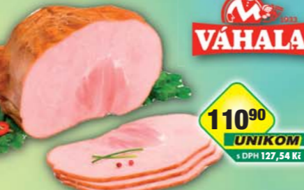
VÁHALA s.r.o., Sváteční uzzené 1kg, obj.č.90866115