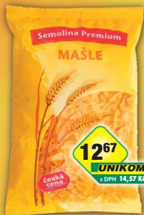
ČESKÁ CENA, Těstoviny semolinové mašle 400g, obj.č.25146200