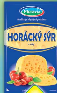
MORAVIA LACTO a.s., Sýr Horácký plátky 30% 100g, obj.č.31704588