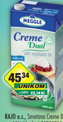
RAJO a.s., Smetana Creme Dual 25% 1l, obj.č.31708710