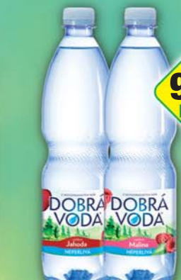
PODĚBRADKA a.s., Dobrá voda jahoda, obj.č.45118118, malina, obj.č.45118177, 0,75l