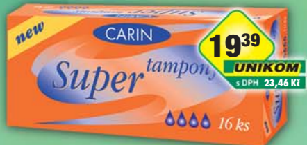
FIDE s.r.o., Tampon Carine super 16ks, obj.č.57993551