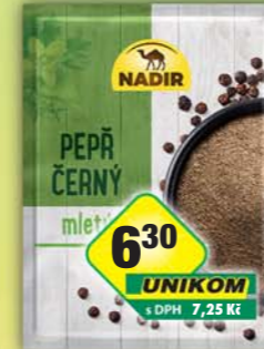
PĚKNÝ - UNIMEX, Pepř černý mletý 20g, obj.č.22151690