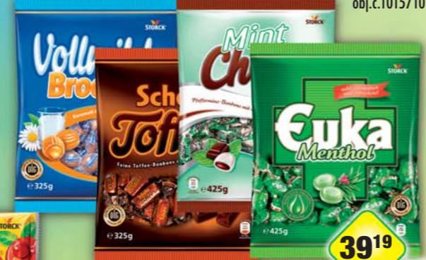
STORCK s.r.o., Euka Menthol, obj.č.14157100, Mint Chocs, obj.č.14157094, 425g, Schoko Toffes, obj.č.14157099, Vollmilch Brocken, obj.č.14157095, 325g