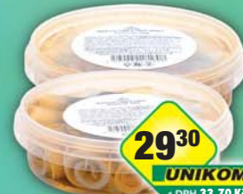
HELEB s.r.o., Kuličky sýrové borevné 250g, obj.č.31842100