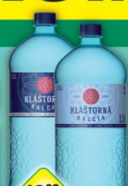
KOFOLA a.s., Kláštorňa kalcia jemná, obj.č.45115888, sycená, obj.č.45115901, 1,5l