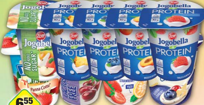
ZOTT s.r.o., Jogurt Jogobella bez laktózy, obj.č.31775354, bez přidaného cukru, obj.č.31775376, Chocolate, obj.č.31775421, Panna Cotta, obj.č.31775420, Protein, obj.č.31775362, Superfood, obj.č.31775361, 150g