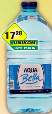
FONTEA a.s., Aqua Bella neperlivá 5l, obj.č.45245102