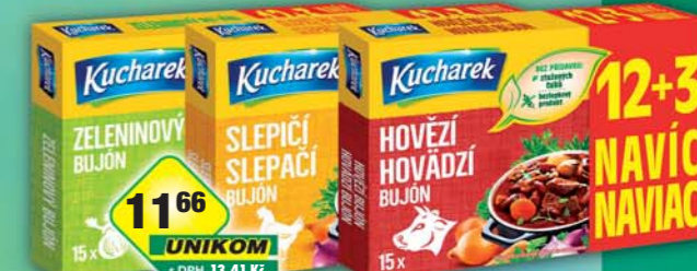
PĚKNÝ - UNIMEX, Kucharek Bujón hovězí, obj.č.28151194, slepičí, obj.č.28151204, zeleninový, obj.č.28151218, 12ks+3ks