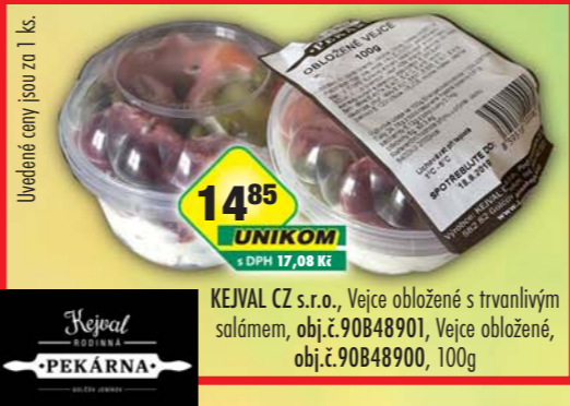
KEJVAL CZ s.r.o., Vejce obložené s trvanlivým salámem, obj.č.90848901, Vejce obložené, obj.č.90848900, 100g