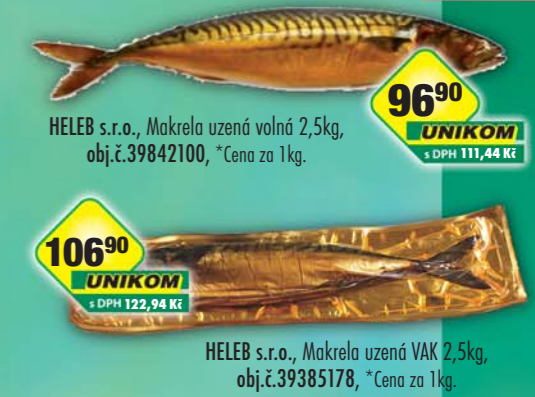
HELEB s.r.o., Makrela uzzená volná 2,5kg, obj.č.39842100, *Cena za 1kg.