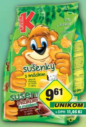
MASPEX s.r.o., Kubik sušenky s kakaem a máslem, obj.č.10119508, s máslem, obj.č.10119525, 100g