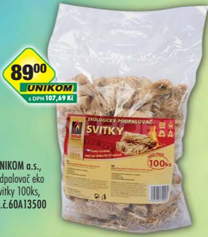
UNIKOM a.s., Podpalovač eko svítky 100ks, obj.č.60A13500