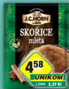
ORKLA FOODS ČR a SR a.s., Skořice mletá 20g, obj.č.22105514