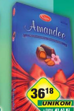
TREBORSWEETS s.r.o., Dezert Amandee s mandlovou náplní 128g, obj.č.13929200