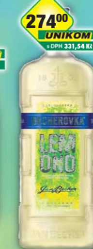
UNIKOM a.s., Becherovka Lemon 20% 1l, obj.č.53579123