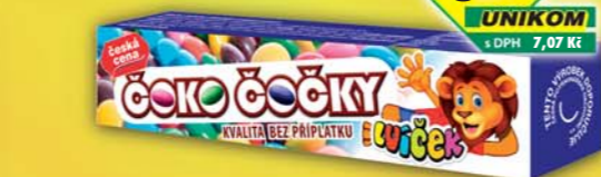
ČESKÁ CENA, Čoko Čočky 25g, obj.č.12155114