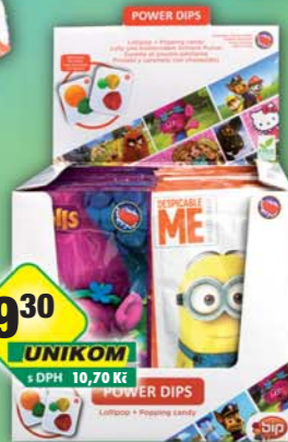
SOCO s.r.o., Lizátka licence mix power dips 12g, obj.č.14413310