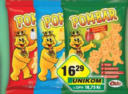
INTERSNACK a.s., Pom-Bär kečup, obj.č.11309751, original, obj.č.11309746, sýr, obj.č.11309764, 50g