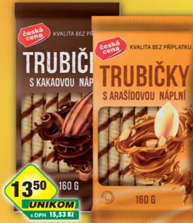
ČESKÁ CENA, Trubičky arašidové, obj.č.10152170, kakaové, obj.č.10152171, 160g