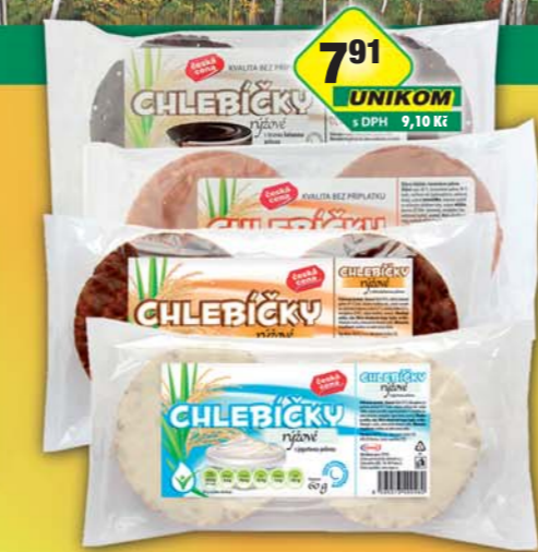
ČESKÁ CENA, Chlebiček rýžový kakaový, obj.č.21197271, s karamellem, obj.č.21197281, jogurtový, obj.č.21197280, mléčnokakaový, obj.č.21197285, 60g