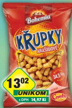
INTERSNACK a.s., Křupky arašídové 100g, obj.č.11306125