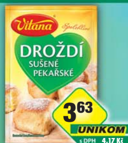
ORKLA FOODS ČR a SR a.s., Droždí sůšené 8g, obj.č.27105130