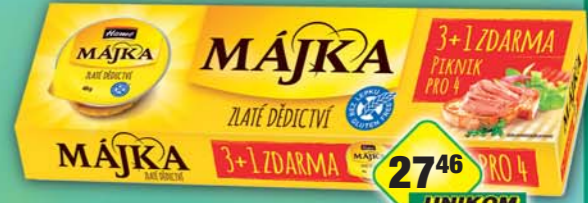
ORKLA FOODS ČR a SR a.s., Májka 3+1 Al48, obj.č.40112366