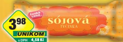
ČESKÁ CENA, Sójová tyčinka 50g, obj.č.14676400

Zboží obržité do vyierpání zásob! Unikom a.s., závod OVO, velkoobchod potravin, Hmčická 193, 284 45 Kutná Hora - Karlov, tel./fax: 327 513 347, 327 514 672, 327 514 143, e-mail: ovo@unikom.cz • Práva na tiskové chyby vyhrazeny.