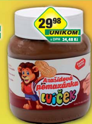
ČESKÁ CENA, Arašidová pomazánka 400g, obj.č.13155790