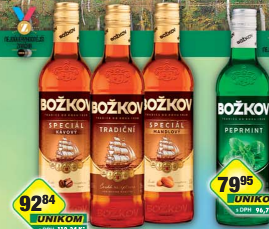
STOCK Plzeň-Božkov s.r.o., Božkov Tradiční 35%, obj.č.53126849, kávový 30%, obj.č.53126087, mandlový 30%, obj.č.53126845, 0,5l