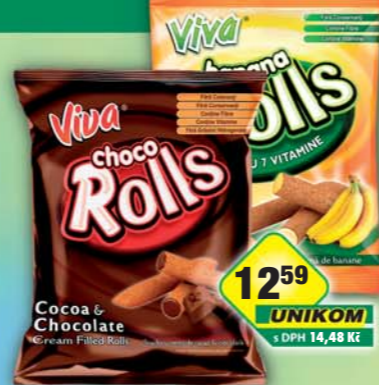
ŠAFRÁNEK JIŘÍ, Trubičky Viva Rolls banán, obj.č.10541729, kakao, obj.č.10541732, 100g