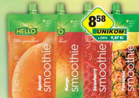
LINEA NIVNICE a.s., Smoothie ananas, obj.č.48124803, jahoda, obj.č.48124801, mango, obj.č.48124800, meruňka, obj.č.48124802, 0,2l