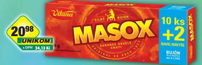
ORKLA FOODS ČR a SR a.s., Masox 10+2ks 144g, obj.č.28105207