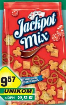
ŠAFRÁNEK JIŘÍ, Jackpot Mix 300g, obj.č.11541665