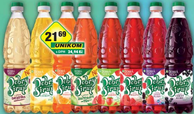
PODĚBRADKA a.s., Sirup Dobry bezinka, obj.č.46117178, citrón, obj.č.46117180, černý rybíz, obj.č.46117185, jahoda, obj.č.46117190, lesní plody, obj.č.46117200, malina, obj.č.46117210, pomeranč, obj.č.46117220, zahradní mix, obj.č.46117260, 0,7l