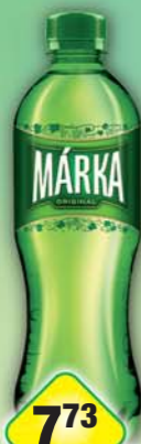
MASPEX CZECH s.r.o., Mária Bílý hrozen 0,5l, obj.č.45119104