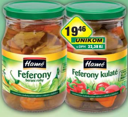
ORKLA FOODS ČR a SR a.s., Feferony beranří rohy, obj.č.35112149, kulaté, obj.č.35112173, T0370