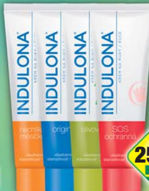
SARANTIS s.r.o., Krém Indulona měsíček, obj.č.56A07134, ochranná, obj.č.56A07125, original, obj.č.56A07129, pánský, obj.č.56A07135, 85ml