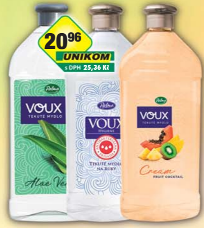
PALMA a.s., Tekuté mýdlo Voux Aloe Vera, obj.č.56862084, Hygiene, obj.č.56862086, Fruit, obj.č.56862085, 1l