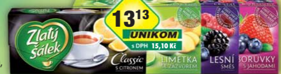
JACOBS DOUWE EGBERTS s.r.o., Čaj Zlatý Sálek Borůvka a jahoda, obj.č.18108305, Classic citrón, obj.č.18108850, Lesní směs, obj.č.18108312, Limetka a zázvor, obj.č.18108323, 35g