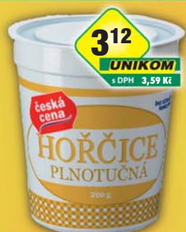
ČESKÁ CENA, Hořčice plnotučná 200g, obj.č.34114160