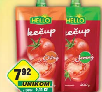
LINEA NIVNICE a.s., Kečup jemný, obj.č.34124120, ostrý, obj.č.34124130, 200g