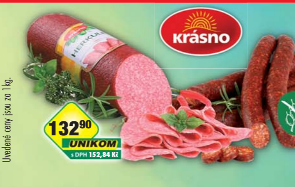
Uvedené ceny jsou za 1kg.