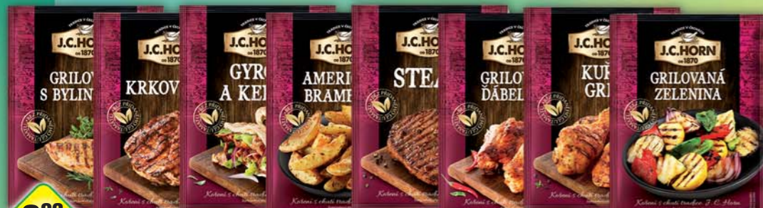
ORKLA FOODS ČR a SR a.s., Gyros a Kebab 20g, obj.č.22105078, Steak 20g, obj.č.22105089, Americké brambory, obj.č.22105077, Grilovací dábel, obj.č.22105085, Grilovací s bylinkami, obj.č.22105082, Grilovaná zelenina, obj.č.22105087, Křkovička, obj.č.22105079, Kuřecí, obj.č.22105083, 30g