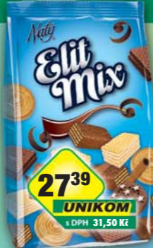
ŠAFRÁNEK JIŘÍ, Naty Elit Mix 300g, obj.č.10541489