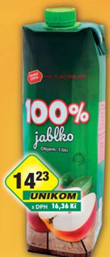
ČESKÁ CENA, Džus jablko 100% 1l, obj.č.47124190