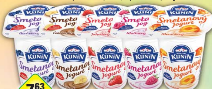
763 UNIKOM s DPH 8,77 Kč