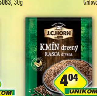
ORKLA FOODS ČR a SR a.s., Kmin drcený 20g, obj.č.22105874