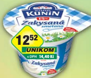
LACTALIS s.r.o., Zakysaná smetana krémovitá 15% 190g, obj.č.31584588