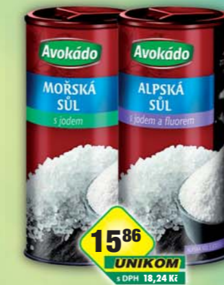
PĚKNÝ - UNIMEX, Sůl alpská s jodem fluorem, obj.č.24151060, mořská s jodem, obj.č.24151250, 330g