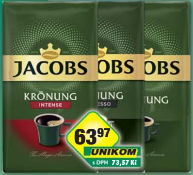
JACOBS DOUWE EGBERTS s.r.o., Káva Krönung, obj.č.15104288, Espresso, obj.č.15104179, Intense, obj.č.15104182, 250g