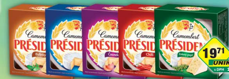
1971 UNIKOM s DPH 22,67 Kč