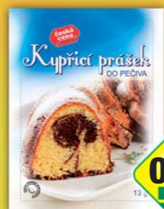
ČESKÁ CENA, Kypřicí prášek do pečiva 13g, obj.č.27114125