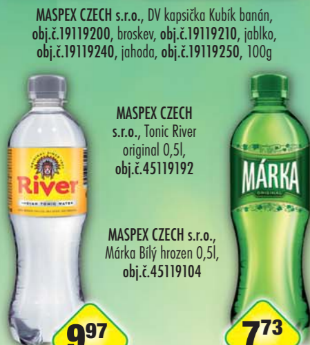
MASPEX CZECH s.r.o., Tonic River original 0,5l, obj.č.45119192