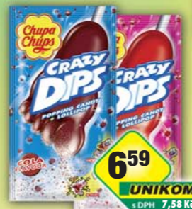
PERFETTI VAN MELLE s.r.o., Lizátka Dips cola, obj.č.14177232, strawberry, obj.č.14177231, 14g