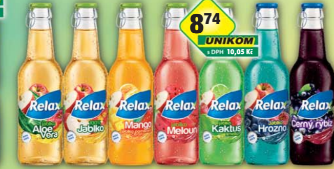
MASPEX CZECH s.r.o., Relax víčko aloe vera, obj.č.45119721, černý rybíz, obj.č.45119565, jablko, obj.č.45119700, jablko/hrozen, obj.č.45119699, kaktus, obj.č.45119703, mango, obj.č.45119706, meloun, obj.č.45119708, 0,25l