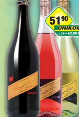
UNIKOM a.s., Fragolino bianco, obj.č.52267062, rosato, obj.č.52267065, rosso, obj.č.51267101, 0,75l