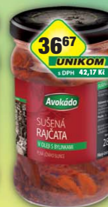
PĚKNÝ - UNIMEX, Rajčata sušená v oleji 280g, obj.č.35151500