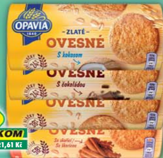
MONDELÉZ s.r.o., Zlaté Ovesné čoko 244g, obj.č.10104255, Ovesné, obj.č.10102574, kokos, obj.č.10102975, skořicové, obj.č.10104261, 215g