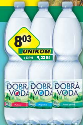
PODĚBRADKA a.s., Dobrá voda jemně perlivá, obj.č.45118140, neperlivá, obj.č.45118149, perlivá, obj.č.45118154, 1,5l