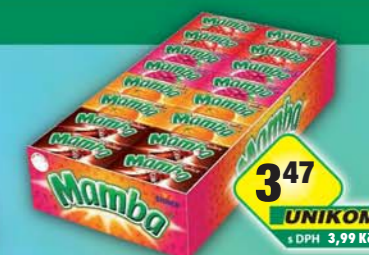
STORCK s.r.o., Mamba karamelka 26,5g, obj.č.12157102