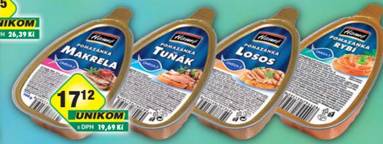
ORKLA FOODS ČR a SR a.s., Lososová pomazánka, obj.č.40112935, Makrelová, obj.č.40112940, Rybí, obj.č.39112987, Tuňáková, obj.č.40112715, 100g