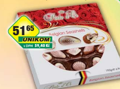
CHOCOLAND a.s., Dezert Mařské plody 195g, obj.č.13155241