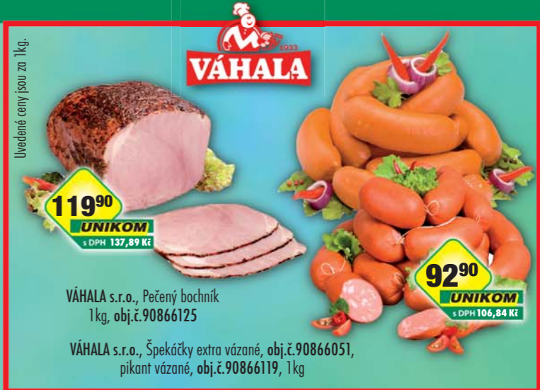
Uvedené ceny jsou za 1kg.