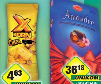
TREBORSWEETS s.r.o., X Korn sýr 35g, obj.č.11791940