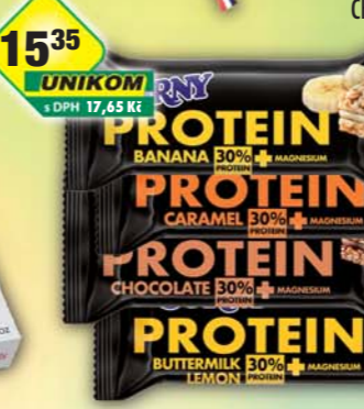
HERO s.r.o., Corny Protein banana, obj.č.21468395, buttermilk lemon, obj.č.21468420, čokoláda, obj.č.21468400, karamel, obj.č.21468410, 35g