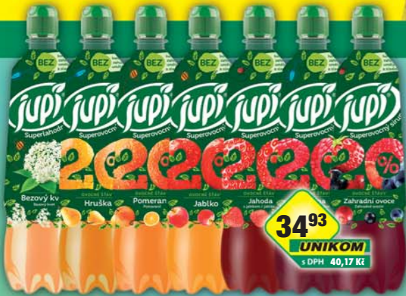
KOFOLA a.s., Sirup Jupí Bezový květ, obj.č.46115859, Hruška, obj.č.46115856, Jablko, obj.č.46115855, Jahoda, obj.č.46115858, Malina, obj.č.46115857, Pomeranč, obj.č.46115853, Zahradní ovoce, obj.č.46115851, 0,7l