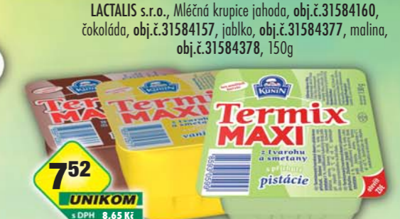
752 UNIKOM s DPH 8,65 Kč