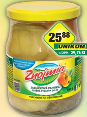
ORKLA FOODS ČR a SR a.s., Jabličková paprika se zelím T0580, obj.č.35112286