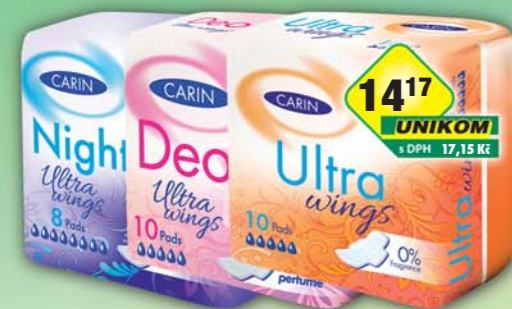
FIDE s.r.o., Vložky Carin deo ultra wings 10ks, obj.č.57288142, night ultra wings 8ks, obj.č.57288144, ultra wings singlet 10ks, obj.č.57288152