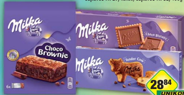
MONDELÉZ s.r.o., Milka Tender cow 140g, obj.č.12104916, Choco brownie, obj.č.12104926, ChocoBiscuit, obj.č.10104220, 150g