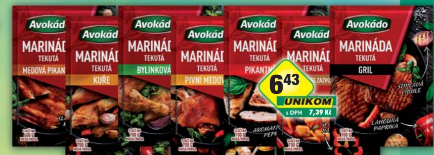
PĚKNÝ - UNIMEX, Marináda medová pikantní 80g, obj.č.23151121, bylinky, obj.č.23151107, grill, obj.č.23151111, kuře, obj.č.23151115, orientální, obj.č.23151129, pikantní, obj.č.23151137, pивní medová, obj.č.23151131, tomatová s česnekem, obj.č.23151133, 90g