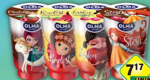
717 UNIKOM s DPH 8,25 Kč