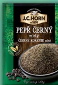
ORKLA FOODS ČR a SR a.s., Peppř černý celý, obj.č.22105886, mletý, obj.č.22105719, 15g