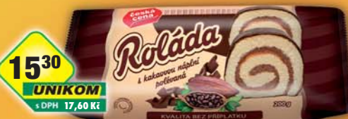
ČESKÁ CENA, Roláda polévaná kakaová 200g, obj.č.10951583