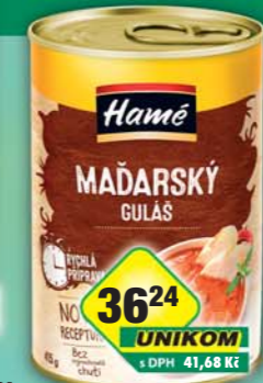
ORKLA FOODS ČR a SR a.s., Guláš maďarský P400, obj.č.42112151