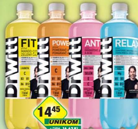
MASPEX CZECH s.r.o., DrWitt Antiox, obj.č.45119070, Fit, obj.č.45119071, PowerC, obj.č.45119073, Relax, obj.č.45119072, 0,75l