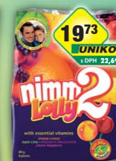
STORCK s.r.o., Lízátka Nimm2 Lolly 80g, obj.č.14157145