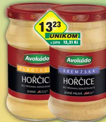
PĚKNÝ - UNIMEX, Horčice kremzská, obj.č.34151053, plnotučná, obj.č.34151049, 288g