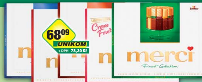
STORCK s.r.o., Merci almond, obj.č.13157105, creme fruit, obj.č.13157066, dark, obj.č.13157101, klasik, obj.č.13157102, milk, obj.č.13157104, 250g