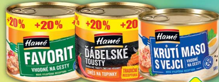
ORKLA FOODS ČR a SR a.s., Ďábelské tousty, obj.č.41112215, Favorit, obj.č.41112122, P180+20%, Krutí maso s vejci P180, obj.č.41112105