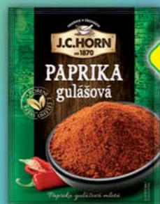
ORKLA FOODS ČR a SR a.s., Paprika gulášová 20g, obj.č.22105367