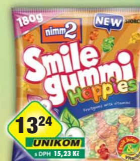
STORCK s.r.o., Nimm2 SG happies 180g, obj.č.14157112