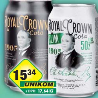
KOFOLA a.s., RC Cola Classic, obj.č.45115347, Slim, obj.č.45115288, 0,33l