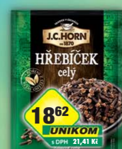
ORKLA FOODS ČR a SR a.s., Hřebíček 15g, obj.č.22105247