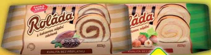
ČESKÁ CENA, Roláda kakaová, obj.č.10951580, lískooříšková, obj.č.10951586, 200g