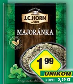
ORKLA FOODS ČR a SR a.s., Majoránka 4g, obj.č.22105305