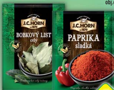
ORKLA FOODS ČR a SR a.s., Bobkový list 4g, obj.č.22105128, Paprika sladká 20g, obj.č.22105379