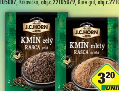
ORKLA FOODS ČR a SR a.s., Kmin celý 20g, obj.č.22105873, mletý 18g, obj.č.22105274