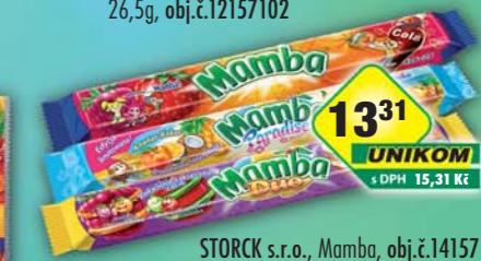
STORCK s.r.o., Mamba do, obj.č.14157141, Mamba do, obj.č.12157090, paradise, obj.č.14157144, 106g