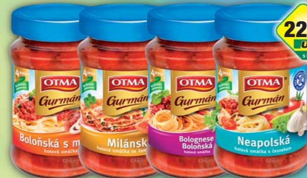
ORKLA FOODS ČR a SR a.s., Omáčka Boloňská, obj.č.30112101, Boloňská s masem, obj.č.32112495, Milánská, obj.č.32112545, Neapolská, obj.č.30112501, 350g