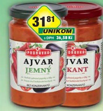
PODRAVKA - LAGRIS a.s., Ajvar jemný, obj.č.30113102, ostrý, obj.č.30113110, 350g