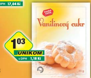
ČESKÁ CENA, Vanilinový cukr 20g, obj.č.27114110