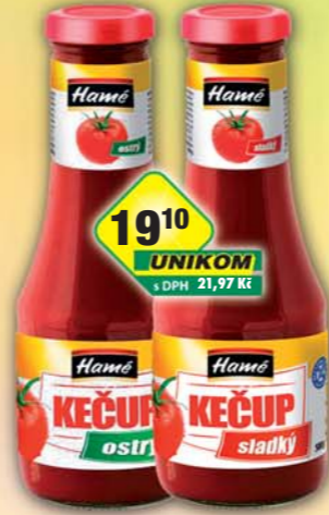
ORKLA FOODS ČR a SR a.s., Kečup ostrý, obj.č.34112151, sladký, obj.č.34112195, T0500