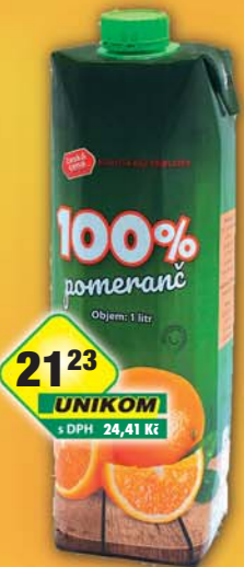
ČESKÁ CENA, Džus pomeranč 100% 1l, obj.č.47124211