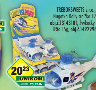
TREBORSWEETS s.r.o., Vrtulník hračka s cukrovinkou 6g, obj.č.14929440