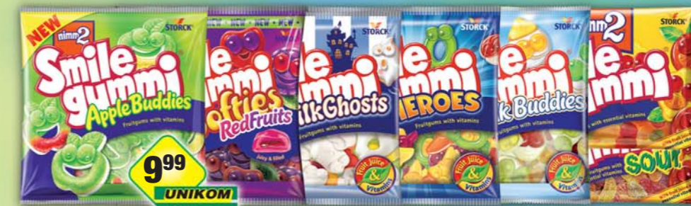
STORCK s.r.o., Nimm2 SG kyselé 100g, obj.č.14157116, ovocné 100g, obj.č.14157115, apple, obj.č.14157150, fruits, obj.č.14157173, heroes, obj.č.14157175, milk buddies, obj.č.14157180, milk ghosts, obj.č.14157156, 90g