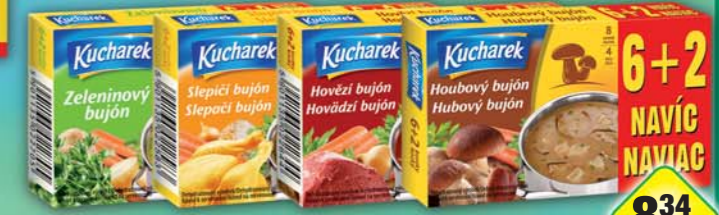
PĚKNÝ - UNIMEX, Bujón houbový, obj.č.28151210, hovězí, obj.č.28151209, slepičí, obj.č.28151207, zeleninový, obj.č.28151208, 6+2ks