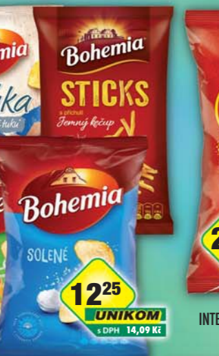
INTERSNACK a.s., Chips Bohemia Zlehka cibulkové 65g, obj.č.11309109, Zlehka solené 65g, obj.č.11309108, paprika, obj.č.11309964, slanina, obj.č.11309965, smetana/cibule, obj.č.11309966, sůl, obj.č.11309967, špiž, obj.č.11309968, Sticks Bohemia jemný kečup, obj.č.11309844, 70g