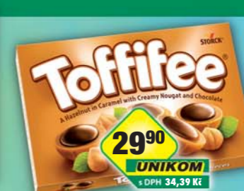
STORCK s.r.o., Toffifee 125g, obj.č.13157117