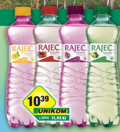
KOFOLA a.s., Rajec angrešt, obj.č.45115193, brusinka, obj.č.45115195, mateřídouška, obj.č.45115213, pampeliška, obj.č.45115245, 0,75l