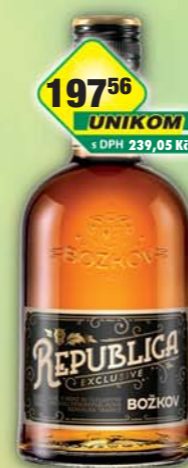
STOCK Plzeň-Božkov s.r.o., Rum Republica Exclusive 38% 0,5l, obj.č.53126081