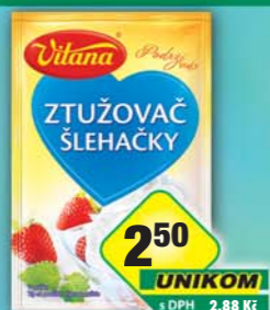
ORKLA FOODS ČR a SR a.s., Ztužovač šlehačky 13g, obj.č.27105951