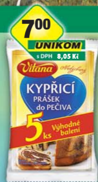
ORKLA FOODS ČR a SR a.s., Kypřicí prášek do pečiva 5x13g, obj.č.27105246