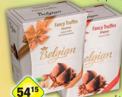
CHOCOLAND a.s., Truffles original, obj.č.13155190, oříškové, obj.č.13155187, 200g