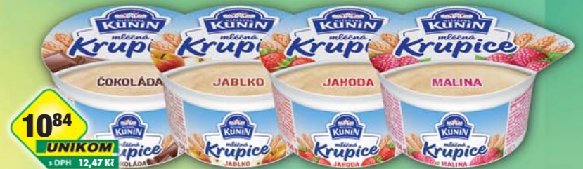
10 84 UNIKOM s DPH 12,47 Kč