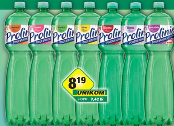
PODĚBRADKA a.s., Poděbradka Proliu bezinka, obj.č.45117178, brusinka, obj.č.45117179, citrón, obj.č.45117164, lesní plody, obj.č.45117181, limetka, obj.č.45117167, malina, obj.č.45117174, pomeranč, obj.č.45117168, 1,5l