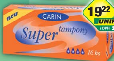
FIDE s.r.o., Tampon Carine super 16ks, obj.č.57993551