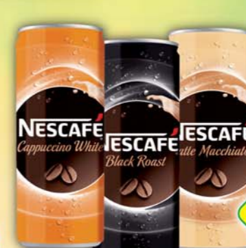
NESTLÉ s.r.o., Nescafé Black, obj.č.48101295, Cappuccino, obj.č.48101300, Latte, obj.č.48101310, 250g