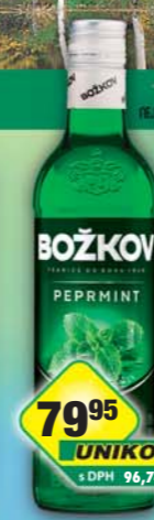
STOCK Plzeň-Božkov s.r.o., Peppermintka 19% 0,5l, obj.č.53126219