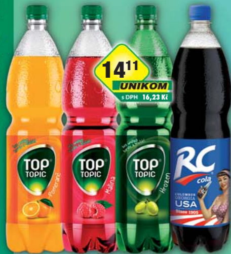
KOFOLA a.s., RC Cola, obj.č.45115294, Top Topic hrozen, obj.č.45115310, malina, obj.č.45115855, pomeranč, obj.č.45115870, 1,5l