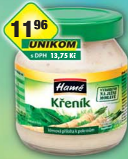
ORKLA FOODS ČR a SR a.s., Křenik T0130, obj.č.37112105