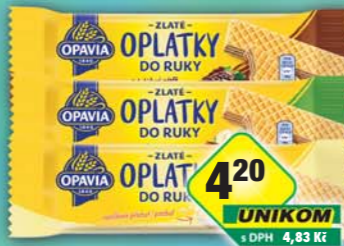
MONDELÉZ s.r.o., Oplatky do ruky čokoláda, obj.č.10104058, liskoříškové, obj.č.10104056, vanilková, obj.č.10104057, 23,4g