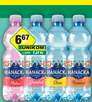
PODĚBRADKA a.s., Hanácká kyselka citrón, obj.č.45246101, grep, obj.č.45246117, malina, obj.č.45246135, pomeranč, obj.č.45246137, 0,5l