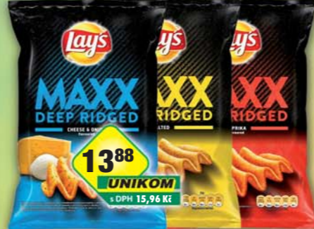
KMV BEV CZ s.r.o., Chips Lays Maxx Paprika, obj.č.11170324, Sůl, obj.č.11170326, Sýr s cibulkou, obj.č.11170322, 65g