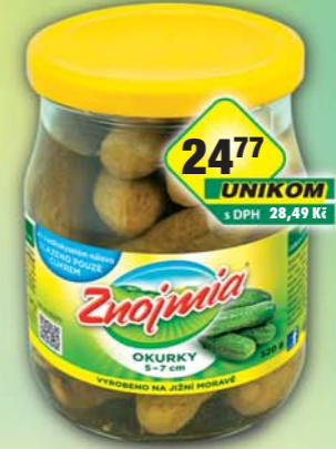
ORKLA FOODS ČR a SR a.s., Okurky 5-7 Znojmia T0580, obj.č.35112235