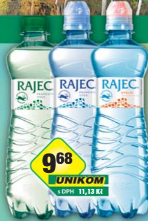
KOFOLA a.s., Rajec jemně perlivý, obj.č.45115202, kyslík, obj.č.45115205, neperlivý, obj.č.45115229, 0,75l