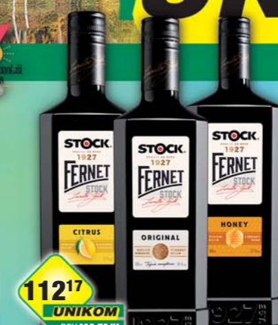
STOCK Plzeň-Božkov s.r.o., Fernet Stock Original 38%, obj.č.53126409, Citrus 27%, obj.č.53126411, Stock Honey 27%, obj.č.53126799, 0,5l