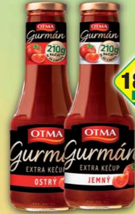
ORKLA FOODS ČR a SR a.s., Kečup Gurmán jemný, obj.č.34105211, ostrý, obj.č.34112111, T0300