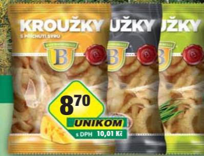
Originální brambůrky s.r.o., Kroužky jarní cibulka, obj.č.11803800, pepřové, obj.č.11803810, sýrové, obj.č.11803815, 50g