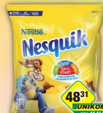
NESTLÉ s.r.o., Kakao Nesquik Plus 400g, obj.č.16101139