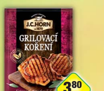
ORKLA FOODS ČR a SR a.s., Grilovací 25g, obj.č.22105200