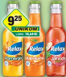
MASPEX CZECH s.r.o., Relax víčko jahoda, obj.č.45119702, multivitamin, obj.č.45119709, pomeranč, obj.č.45119712, 0,25l