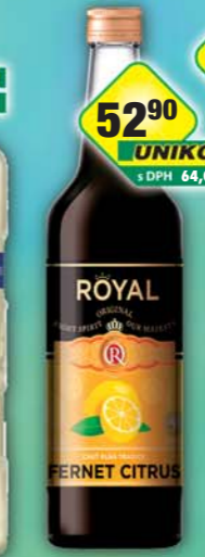
UNIKOM a.s., Fernet Citrus Royal 20% 0,5l, obj.č.53268300