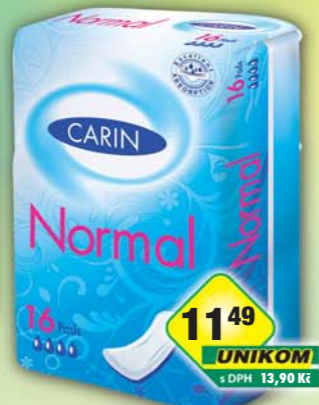
FIDE s.r.o., Vložky Carin normal 16ks, obj.č.57288148