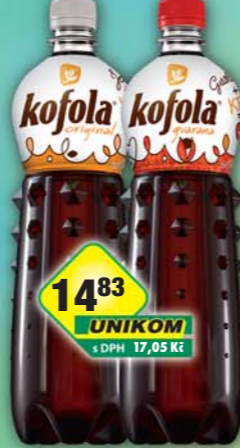
KOFOLA a.s., Kofola guarana, obj.č.45115148, original, obj.č.45115154, 1l