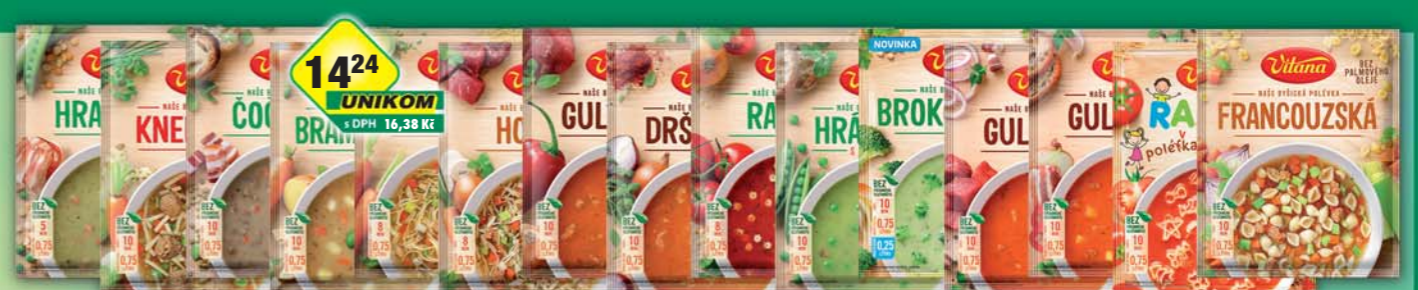
ORKLA FOODS ČR a SR a.s., Polávka brokolicevá 56g, obj.č.28105244, bramborová 68g, obj.č.28105619, čočková 90g, obj.č.28105271, dřstková 92g, obj.č.28105281, francouzská 50g, obj.č.28105300, gulášová 96g, obj.č.28105625, gulášová pikantní 72g, obj.č.28105626, gulášová svačtinová 96g, obj.č.28105627, hovězí 60g, obj.č.28105357, hrachová se slaninou 75g, obj.č.28105517, hrášková s uzeným masem 64g, obj.č.28105302, rajská 76g, obj.č.28105489, rajská na vyletě v lese 86g, obj.č.28105491, s játrovými knedličky 58g, obj.č.28105501, slepičí vývar s nudlemi 50g, obj.č.28105303