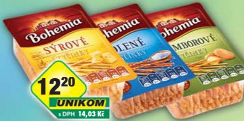
INTERSNACK a.s., Tyčinky bramborové, obj.č.11309850, slané, obj.č.11309884, sýrové, obj.č.11309890, 85g