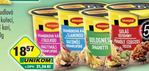
NESTLÉ s.r.o., Boloňské špagety 61g, obj.č.28101147, Bramborová kaše s cibulí 59g, obj.č.28101159, Bramborová kaše se slaninou 53g, obj.č.28101156, Guláš s těstovinami 55g, obj.č.28101155