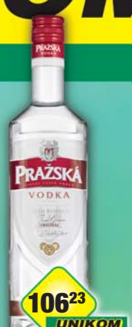
STOCK Plzeň-Božkov s.r.o., Vodka Pražská 37,5% 0,5l, obj.č.53478740