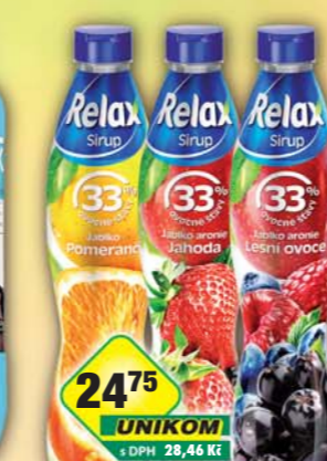
MASPEX CZECH s.r.o., Sirup Relax jahoda, obj.č.46119299, lesní směs, obj.č.46119305, pomeranč, obj.č.46119315, 0,7l