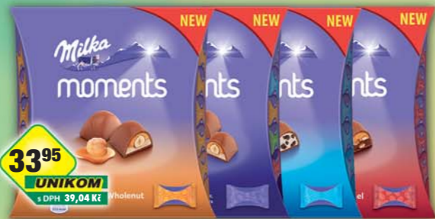
MONDELÉZ s.r.o., Milka Moments Almond 96g, obj.č.13104405, Assortment 97g, obj.č.13104407, Oreo 92g, obj.č.13104409, Toffee 97g, obj.č.13104410