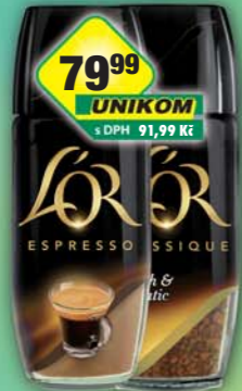
JACOBS DOUWE EGBERTS s.r.o., Káva LOR Classique, obj.č.15108850, Espresso, obj.č.15108880, 100g