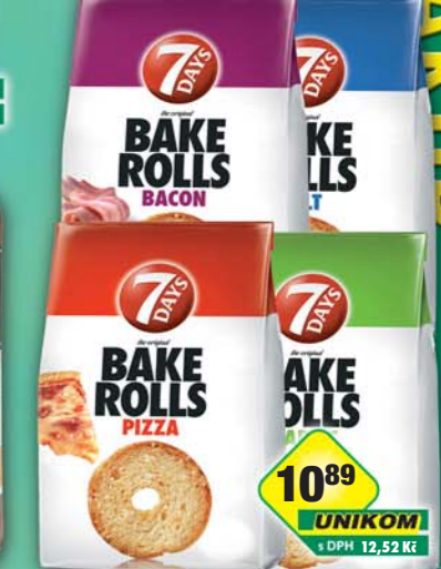
CHIPITA s.r.o., Bake Rolls slanina 70g, obj.č.11168107, česnek, obj.č.11168102, pizza, obj.č.11168105, solené, obj.č.11168103, 80g