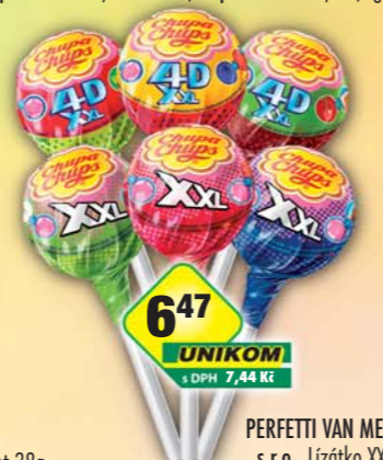
PERFETTI VAN MELLE s.r.o., Lizátka XXL, obj.č.14177237, XXL 4D, obj.č.14177247, 29g