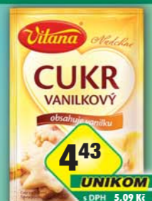
ORKLA FOODS ČR a SR a.s., Vanilkový cukr 10g, obj.č.27105263