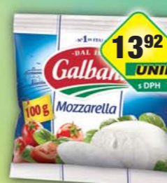
LACTALIS s.r.o., Mozzarella Galbani 100g, obj.č.31584669