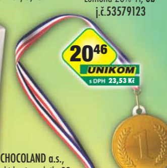
CHOCOLAND a.s., Čokoládové medaile 23g, obj.č.12155083