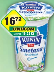
1672 UNIKOM s DPH 19,22 Kč