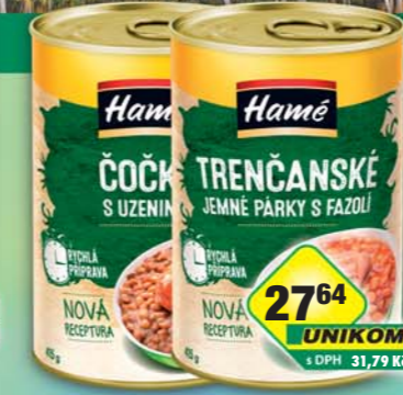
ORKLA FOODS ČR a SR a.s., Čočka s klobásou, obj.č.42112101, Trenčianský párek s fazolou, obj.č.42112359, P400