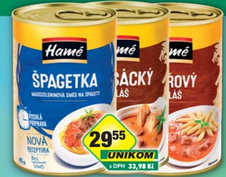
ORKLA FOODS ČR a SR a.s., Guláš vepřový, obj.č.42112185, Guláš zálesácký, obj.č.42112193, Špagetka, obj.č.42112497, P400