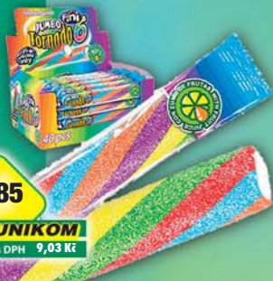
SOCO s.r.o., Pendrek Fini tornádo 50g, obj.č.14140970