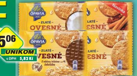
MONDELÉZ s.r.o., Zlaté Ovesné čoko 32,5g, obj.č.10104254, Ovesné, obj.č.10104257, kokos, obj.č.10104256, skořicové, obj.č.10104258, 37,5g