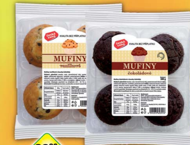
ČESKÁ CENA, Muffini čokoládová, obj.č.10707582, vanilka, obj.č.10707581, 300g