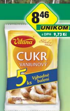
ORKLA FOODS ČR a SR a.s., Vanilinový cukr 5x20g, obj.č.27105268