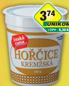
ČESKÁ CENA, Hořčice kremžská 200g, obj.č.34114115