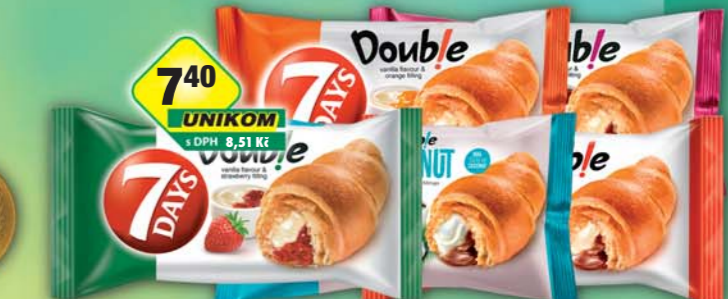
CHIPITA s.r.o., Croissant kakao/kokos, obj.č.10168090, kakao/vanilka, obj.č.10168094, vanilka/jahoda, obj.č.10168091, vanilka/pomeranč, obj.č.10168093, vanilka/víšeň, obj.č.10168095, 60g