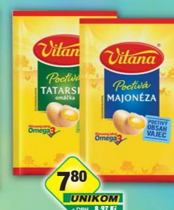
ORKLA FOODS ČR a SR a.s., Majoneza Pochtivá, obj.č.32105046, Tatarská omáčka, obj.č.32105198, 90ml