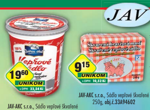
JAV-AC s.r.o., Sádlo vepřové skvarené 500g, obj.č.33219300