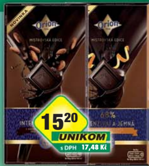
UNIKOM a.s., Čokoláda hořká s pomerančem a skořicí, obj.č.12101069, z kakaových bobů, obj.č.12101252, 100g