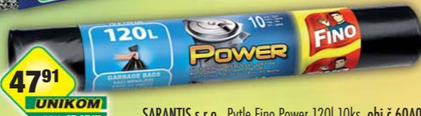
SARANTIS s.r.o., Pytle Fino Power 120l 10ks, obj.č.60A07236