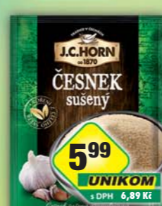
ORKLA FOODS ČR a SR a.s., Česnek sušený 25g, obj.č.22105147