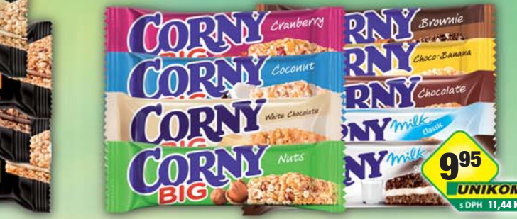
HERO s.r.o., Corny Big banán 50g, obj.č.21468141, borůvka 40g, obj.č.21468301, brownie 50g, obj.č.21468145, brusinka 50g, obj.č.21468149, čokoláda 50g, obj.č.21468151, horká čokoláda 50g, obj.č.21468157, kokos 50g, obj.č.21468162, milk 40g, obj.č.21468210, milk/choco 40g, obj.č.21468212, oříšek 50g, obj.č.21468171, white 40g, obj.č.21468300