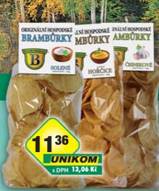
Originální brambůrky s.r.o., Brambůrky Hospodské česnek, obj.č.11803100, hořčice, obj.č.11803112, solené, obj.č.11803110, 100g