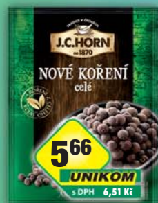
ORKLA FOODS ČR a SR a.s., Nové koření 15g, obj.č.22105692