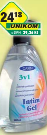
FIDE s.r.o., Intim gel 3v1 500ml, obj.č.56288050