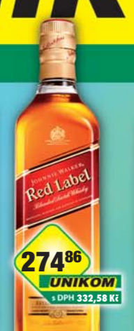
STOCK Plzeň-Božkov s.r.o., Johnnie Walker Red Label 40% 0,7l, obj.č.53318738