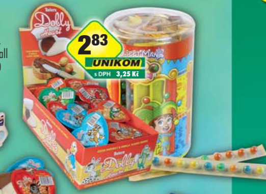
TREBORSWEETS s.r.o., Nugetka Dolly srdíčko 19g, obj.č.13143101, Žvýkačky Ball lišta 15g, obj.č.14929980