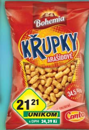
INTERSNACK a.s., Křupky arašídové 200g, obj.č.11306126