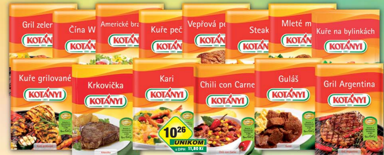
Johann Kotányi, Americké brambory 30g, obj.č.22137101, Čína Wok 38g, obj.č.22137143, Gril Argentina 40g, obj.č.22137153, Gril zelenina 35g, obj.č.22137750, Grilované kuře 30g, obj.č.22137257, Guláš 26g, obj.č.22137193, Chili con Carne 25g, obj.č.22137211, Kari 27g, obj.č.22137213, Křkovička 30g, obj.č.22137544, Kuře na bylinkách 30g, obj.č.22137146, Kuře pečené 30g, obj.č.22137269, Mleté maso 23g, obj.č.22137285, Steak 40g, obj.č.22137477, Vepřová pečené 30g, obj.č.22137501