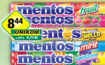
PERFETTI VAN MELLE s.r.o., Mentos fruit 38g, obj.č.14177161, mint 38g, obj.č.14177201, rainbow 37,5g, obj.č.14177214, say hello lemonade 37,5g, obj.č.14177981, strawberry mix 37,5g, obj.č.14177979