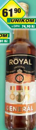
UNIKOM a.s., Tuzemský Generál Royal 33% 0,5l, obj.č.53128131