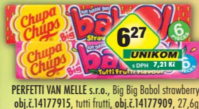
PERFETTI VAN MELLE s.r.o., Big Big Babol strawberry, obj.č.14177915, tutti frutti, obj.č.14177909, 27,6g