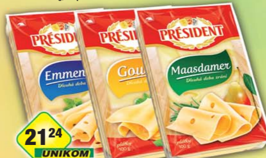
LACTALIS s.r.o., Sýr Maasdammer, obj.č.31584629, Emmentál, obj.č.31584630, Gouda, obj.č.31584632, 100g