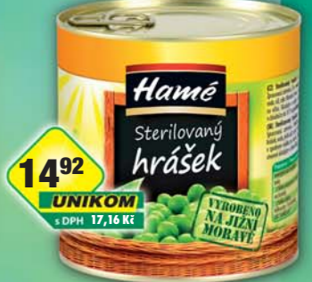
ORKLA FOODS ČR a SR a.s., Hrášek 400g, obj.č.35112182