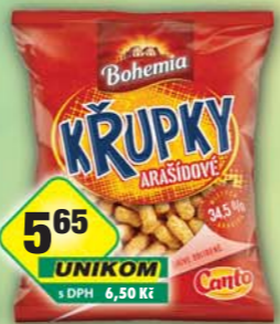
INTERSNACK a.s., Křupky arašídové 50g, obj.č.11306128