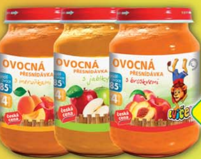
ČESKÁ CENA, Ovocná přesnídávka s meruňkami, jablky, broskvemi, 190g, obj.č.19112090, 19112096, 19112100