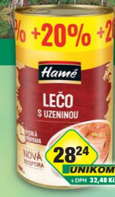
ORKLA FOODS ČR a SR a.s., Lečo s uzeninou P400, obj.č.42112222