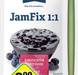
LABETA a.s., Jam Fix 1:1 25g, obj.č.27136127