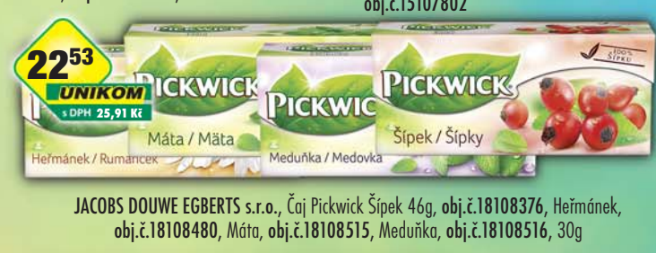
JACOBS DOUWE EGBERTS s.r.o., Čaj Pickwick Šípek 46g, obj.č.18108376, Heřmáněk, obj.č.18108480, Máta, obj.č.18108515, Meduňka, obj.č.18108516, 30g