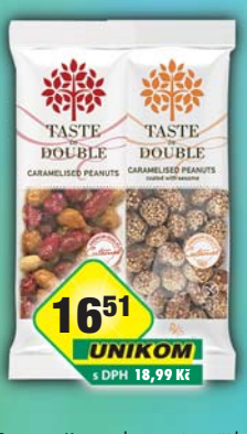
SOCO s.r.o., Karamelizované arašidy mix, obj.č.11937051, arašidy se sezamem, obj.č.11937050, 100g