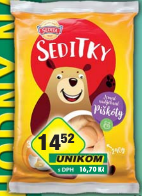
I.D.C. a.s., Piškoty kulaté 240g, obj.č.10103190