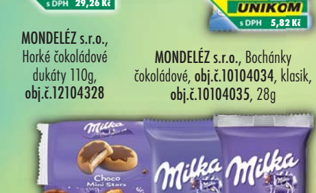
MONDELÉZ s.r.o., Milka Biscuits cake&choc 35g, obj.č.10104117, Choco cow 40g, obj.č.10104221, Choco grains 42g, obj.č.10104222, Choco mini stars 37,5g, obj.č.10104115, Tender cow 28g, obj.č.10104118