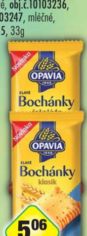
MONDELÉZ s.r.o., Bochánky čokoládové, obj.č.10104034, klasik, obj.č.10104035, 28g