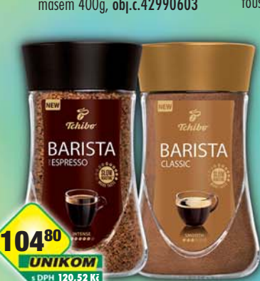
TCHIBO s.r.o., Tchibo Barista classic instant 180g, obj.č.15107806, espresso 200g, obj.č.15107802