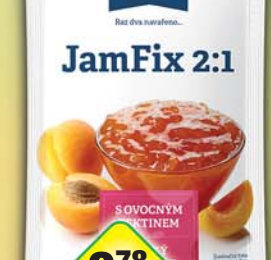
LABETA a.s., Jam Fix 2:1 25g, obj.č.27136128