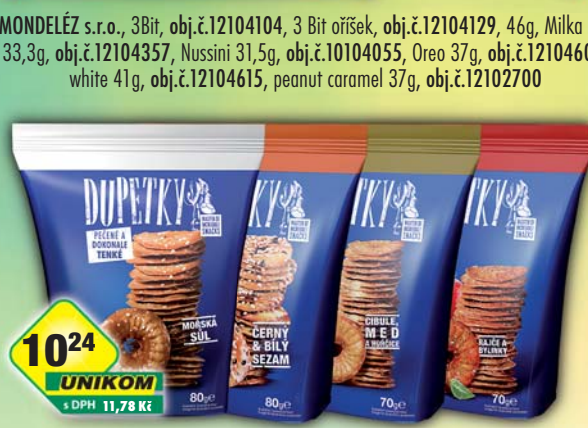
PERFETTI VAN MELLE s.r.o., Dupetky pečené&hořčice-med-cibule, obj.č.11177106, pečené&raječe-bylinky, obj.č.11177109, 70g, pečené&sezam, obj.č.11177100, pečené&solené, obj.č.11177105, 80g