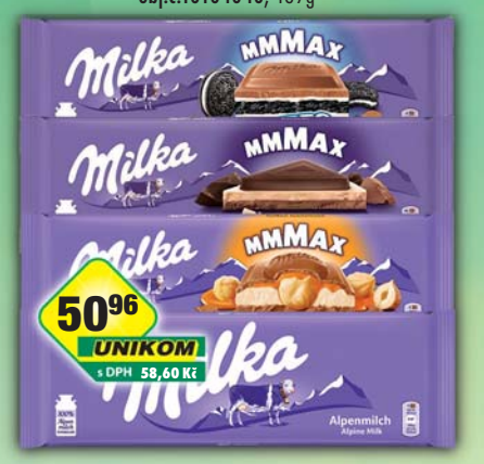
MONDELÉZ s.r.o., Milka Oreo, obj.č.12104976, Milka Toffee wholenut, obj.č.12104901, 300g, Triolade 280g, obj.č.12104243, mléčná 270g, obj.č.12104358