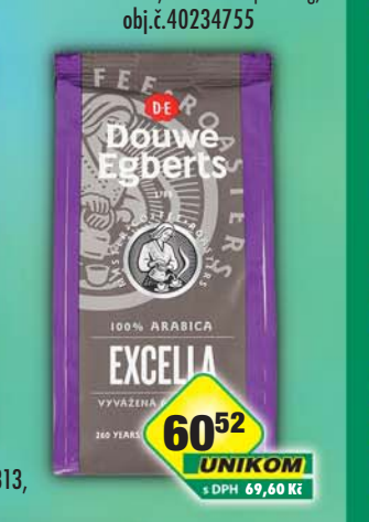
JACOBS DOUWE EGBERTS s.r.o., DE Excella 200g, obj.č.15108155