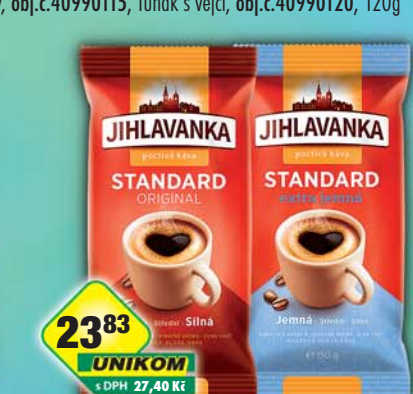
TCHIBO s.r.o., Jihlavanka standard extra jemná, obj.č.15107313, standard original, obj.č.15107323, 150g