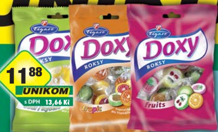
I.D.C. a.s., Doxy roky fruits, obj.č.14103112, kyselé, obj.č.14103107, tropic, obj.č.14103114, 90g