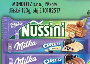
MONDELÉZ s.r.o., 3Bit, obj.č.12104104, 3 Bit oříšek, obj.č.12104129, 46g, Milka Leo 33,3g, obj.č.12104357, Nussini 31,5g, obj.č.10104055, Oreo 37g, obj.č.12104609, white 41g, obj.č.12104615, peanut caramel 37g, obj.č.12102700