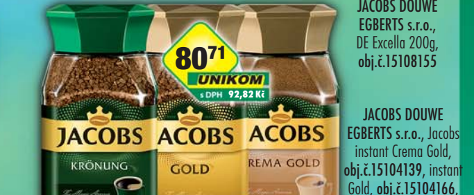
JACOBS DOUWE EGBERTS s.r.o., Jacobs instant Crema Gold, obj.č.15104139, instant Gold, obj.č.15104166, instant Krönung, obj.č.15104148, 100g