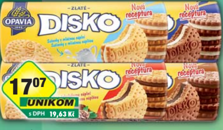
MONDELÉZ s.r.o., Disko čokoládová náplň, obj.č.10104036, kakao s čokoládovou náplní, obj.č.10104037, kakao s mléčnou náplní, obj.č.10104038, mléčná náplň, obj.č.10104040, 169g