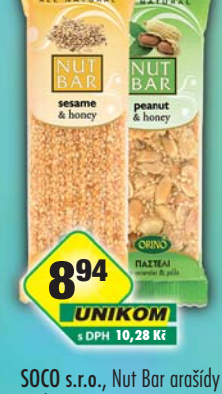
SOCO s.r.o., Nut Bar arašidy s medem, obj.č.21140370, sezam s medem, obj.č.21140378, 45g