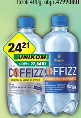
TCHIBO s.r.o., Coffizz Lemon & Mint Flavour, obj.č.45107045, Passion Fruit Flavour, obj.č.45107050, 500ml