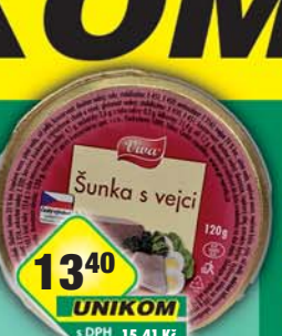
UNIKOM a.s., Šunka s vejci 120g, obj.č.40234755