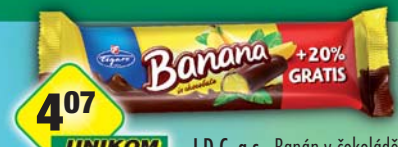
I.D.C. a.s., Banán v čokoládě 25g +20%, obj.č.12103081