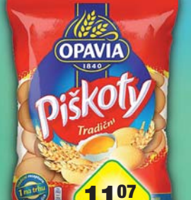
MONDELÉZ s.r.o., Piškoty dětské 120g, obj.č.10102517