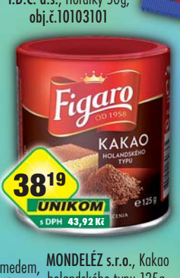
MONDELÉZ s.r.o., Kakao holandského typu 125g, obj.č.16104366