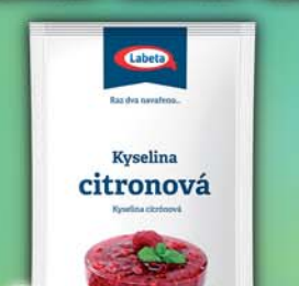
LABETA a.s., Kyselina citronová 40g, obj.č.27136135