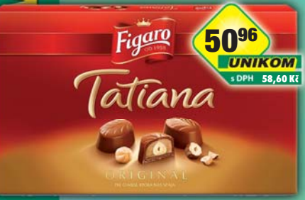
MONDELÉZ s.r.o., Tatiana 140g, obj.č.13104179