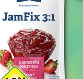
LABETA a.s., Jam Fix 3:1 25g, obj.č.27136130