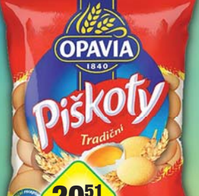
MONDELÉZ s.r.o., Piškoty dětské 240g, obj.č.10102518