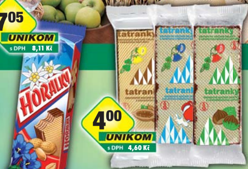
I.D.C. a.s., Horalky 50g, obj.č.10103101