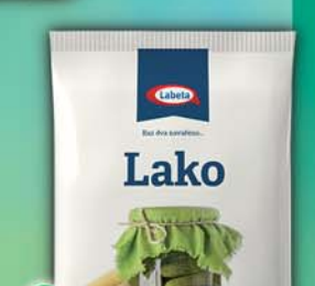
LABETA a.s., Lako na nakládání okurek 100g, obj.č.27136138