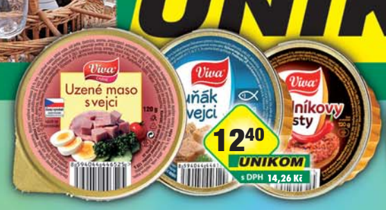
UNIKOM a.s., Uzené maso s vejci, obj.č.40234110, Pekelnikovy tousty, obj.č.40990115, Tuňák s vejci, obj.č.40990120, 120g