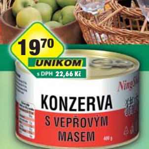
UNIKOM a.s., Konzerva s vepřovým masem 400g, obj.č.42990603