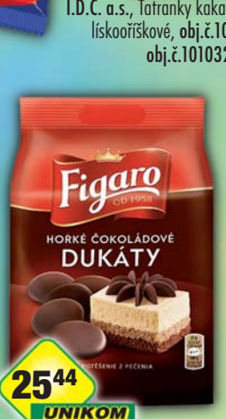
MONDELÉZ s.r.o., Horké čokoládové dukáty 110g, obj.č.12104328