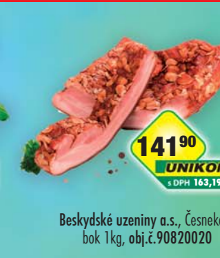
Beskydské uzeniny a.s., Česnekový bok 1kg, obj.č.90820020