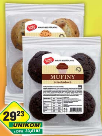
ČESKÁ CENA, Muffini čokoláda, obj.č.10707582, vanilka, obj.č.10707581, 300g