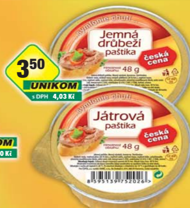
ČESKÁ CENA, Paštika jemná drůbeží, obj.č.40112156, játrová, obj.č.40112216, 48g