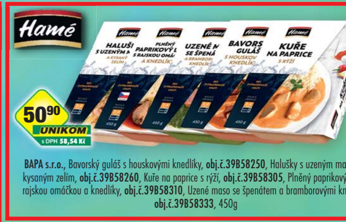
BAPA s.r.o., Bavorský guláš s houskovými knedlíky, obj.č.39B58250, Halušky s uzeným masem a kysaným zelím, obj.č.39B58260, Kuře na paprice s rýží, obj.č.39B58305, Plněný paprikový lusk s rajskou omáčkou a knedlíky, obj.č.39B58310, Uzené maso se špenátem a bramborovými knedlíky, obj.č.39B58333, 450g