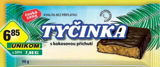
ČESKÁ CENA, Tyčinka s kokosovou příchutí 90g, obj.č.12937799