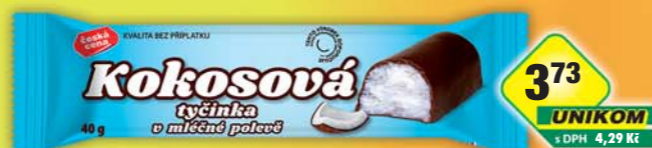
ČESKÁ CENA, Tyčinka kokosová 40g, obj.č.12937800