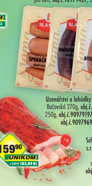
Schneider Food, s.r.o., Maďarská pikantní slanina 1kg, obj.č.90979650