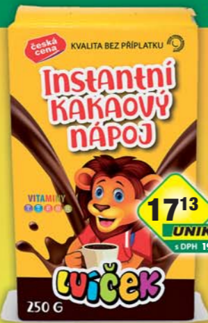
ČESKÁ CENA, Kakaový nápoj 250g, obj.č.16114154