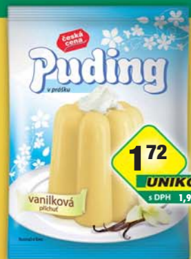
ČESKÁ CENA, Pudink vanilka 38g, obj.č.27628451