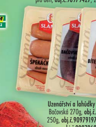
Uzenářství a lahůdky Sláma s.r.o., Klobása Bačovská 270g, obj.č.90979199, Bítešská 250g, obj.č.90979197, Špekáčky TOP 370g, obj.č.90979694, *Cena za ks.