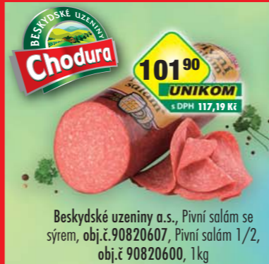
Beskydské uzeniny a.s., Pivní salám se sýrem, obj.č.90820607, Pivní salám 1/2, obj.č.90820600, 1kg

Unikom a.s., z.s.vod OVO, velkoobchod potravin, Hmčická 193, 284 45 Kutná Hora - Karlav, tel./fax: 327 513 347, 327 514 672, 327 514 143, e-mail: ovo@unikom.cz • Práva na tiskové chyby vyhrazeny.