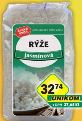
ČESKÁ CENA, Rýže jasmínová 1kg, obj.č.24130111