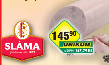
Uzenářství a lahůdky Sláma s.r.o., Dušená šunka nejvyšší jakosti 1kg, obj.č.90979731