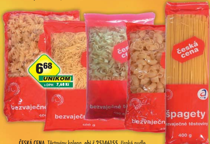
ČESKÁ CENA, Těstoviny kolena, obj.č.25146155, široké nudle, obj.č.25146245, špagety, obj.č.25146354, vlasové nudle, obj.č.25146253, vřetena, obj.č.25146381, 400g