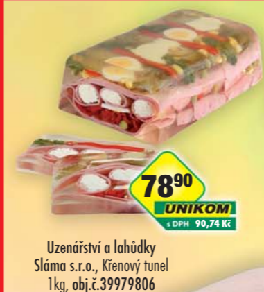
Uzenářství a lahůdky Sláma s.r.o., Křenový tunel 1kg, obj.č.39979806