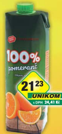
ČESKÁ CENA, Džus pomeranč 100% 1l, obj.č.47124211