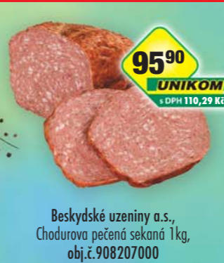
Beskydské uzeniny a.s., Chodurova pečená sekaná 1kg, obj.č.908207000