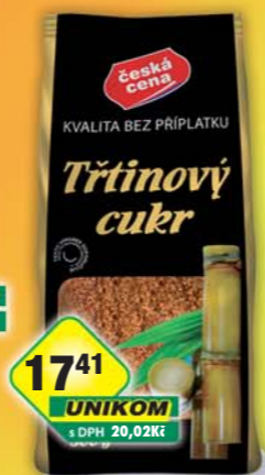
ČESKÁ CENA, Třtinový cukr 500g, obj.č.24210098