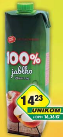
ČESKÁ CENA, Džus jablko 100% 1l, obj.č.47124190