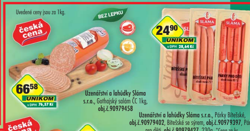
Uzenářství a lahůdky Sláma s.r.o., Gothažský salám ČČ 1kg, obj.č.90979458