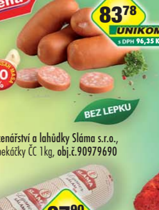
Uzenářství a lahůdky Sláma s.r.o., Špekáčky ČČ 1kg, obj.č.90979690