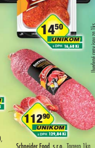
Schneider Food, s.r.o., Torrero 1kg, obj.č.90865610, *Cena za kg.