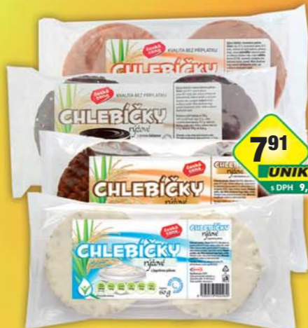
ČESKÁ CENA, Chlebiček rýžový kakaový, obj.č.21197271, rýžový s karamellem, obj.č.21197281, rýžový jogurtový, obj.č.21197280, rýžový mléčnokakaový, obj.č.21197285, 60g