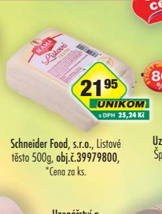
Schneider Food, s.r.o., Listové těsto 500g, obj.č.39979800, *Cena za ks.