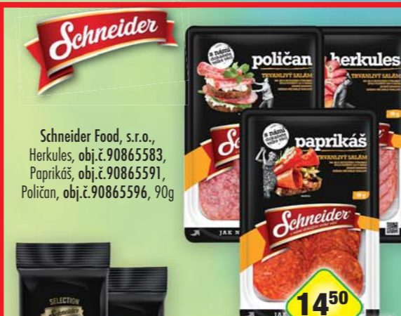
Schneider Food, s.r.o., Herkules, obj.č.90865583, Paprikáš, obj.č.90865591, Poličan, obj.č.90865596, 90g