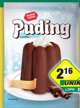
ČESKÁ CENA, Pudink čokoláda 38g, obj.č.27628438