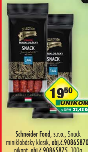
Schneider Food, s.r.o., Snack miniklobásky klasik, obj.č.90865870, pikant, obj.č.90865875, 100g