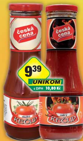
ČESKÁ CENA, Kečup ostrý, obj.č.34112176, sladký, obj.č.34112181, TO300