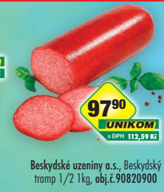
Beskydské uzeniny a.s., Beskydský tramp 1/2 1kg, obj.č.90820900