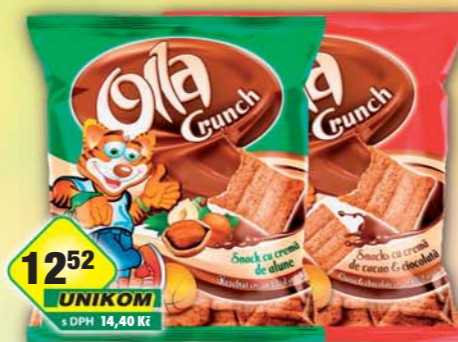
ŠAFRÁNEK JIŘÍ, Olla Crunch kakao, obj.č.21541500, ořech, obj.č.21541508, 100g