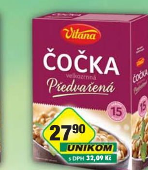
ORKLA FOODS ČR a SR a.s., Předvařená čočka 400g, obj.č.24105110