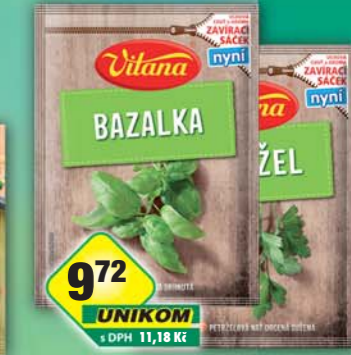
ORKLA FOODS ČR a SR a.s., Bazalka 8g, obj.č.22105006, Petržel nať 5g, obj.č.22105721