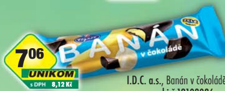
I.D.C. a.s., Banán v čokoládě 40g, obj.č.12103086