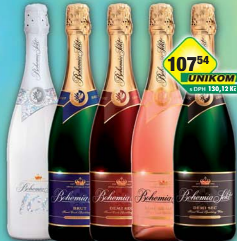
BOHEMIA SEKT s.r.o., Bohemia Sekt brut, obj.č.52478687, demi, obj.č.52478703, červený, obj.č.52478715, rose demi, obj.č.52478825, lce, obj.č.52478802, 0,75l