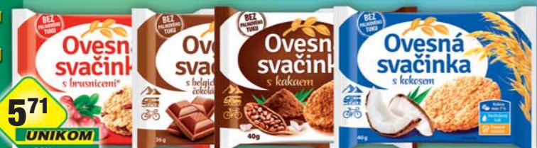
FAMMILKY s.r.o., Ovesná svačinka brusnice, obj.č.10165655, čokoláda, obj.č.10165660, 36g, kakao, obj.č.10165667, kokos, obj.č.10165671, 40g