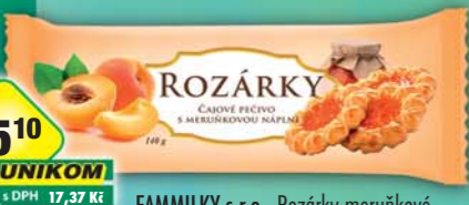
FAMMILKY s.r.o., Rozárky meruňkové 140g, obj.č.10165749