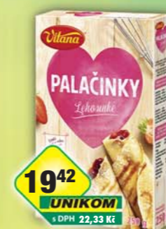
ORKLA FOODS ČR a SR a.s., Palačinky 250g, obj.č.27105201