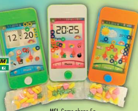
MSI, Game phone 5g, obj.č.14492350