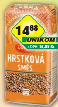
ORKLA FOODS ČR a SR a.s., Hrstková směs 445g, obj.č.24105137