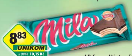
I.D.C. a.s., Mila řezý 50g, obj.č.10103125