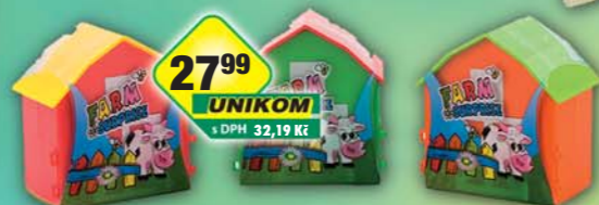
MSI, Farm Surprise 10g, obj.č.14492343