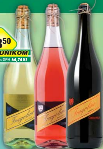
IGRISTOE - TRADING s.r.o., Fragolino bianco, obj.č.52267062, rosato, obj.č.52267065, rosso, obj.č.51267101, 0,75l