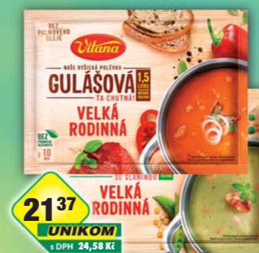
ORKLA FOODS ČR a SR a.s., Polévka rodinná gulášová 190g, obj.č.28105323, hrachová 150g, obj.č.28105368