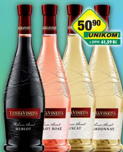
ADVEAL s.r.o., Chardonnay, obj.č.50877210, Merlot, obj.č. 51877346, Merlot rosé, obj.č.51877351, Muscat, obj.č.50877231, 0,75l