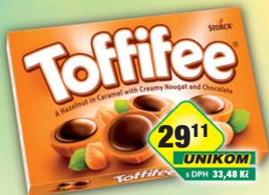
UNIKOM a.s., Toffifee 125g, obj.č.13157117