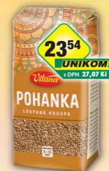
ORKLA FOODS ČR a SR a.s., Pohanka kroupa 425g, obj.č.25105090