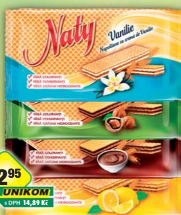
ŠAFRÁNEK JIŘÍ, Naty citronové, obj.č.10541200, kakaové, obj.č.10541220, ořechové, obj.č.10541235, vanilkové, obj.č.10541245, 160g