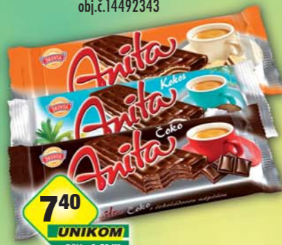
I.D.C. a.s., Anita čoko, obj.č.10103030, kokos, obj.č.10103219, nugát, obj.č.10103045, 50g