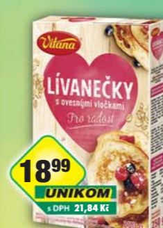
ORKLA FOODS ČR a SR a.s., Lívanečky s vložkami 250g, obj.č.27105186