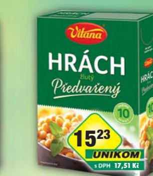
ORKLA FOODS ČR a SR a.s., Hrách žlutý předvařený 350g, obj.č.24105135