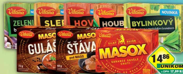
ORKLA FOODS ČR a SR a.s., Bujón bylinkový s česnekem, obj.č.28105142, houbový s hříbký, obj.č.28105143, hovězí, obj.č.28105223, slepičí, obj.č.28105224, zeleninový, obj.č.28105225, 60g, Masox Štáva pod maso 60g, obj.č.30105228, Masox 6ks, obj.č.28105206, Masox guláš 6ks, obj.č.28105217, 72g