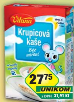
ORKLA FOODS ČR a SR a.s., Kaše krupicová instantní 250g, obj.č.26105121