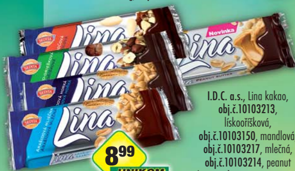
I.D.C. a.s., Lina kakao, obj.č.10103213, lískaoříšková, obj.č.10103150, mandlová, obj.č.10103217, mlečná, obj.č.10103214, peanut butter, obj.č.10103212, 60g