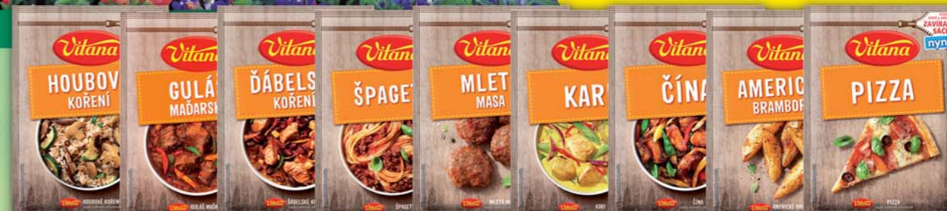
ORKLA FOODS ČR a SR a.s., Americké brambory 28g, obj.č.22105002, Čína 28g, obj.č.22105012, Ďábelské 28g, obj.č.22105015, Guláš maďarský 28g, obj.č.22105029, Houbové 25g, obj.č.22105032, Italské bylinky 7g, obj.č.22105036, Kari 28g, obj.č.22105039, Kuře 7 bylin 28g, obj.č.22105047, Mletá masa 28g, obj.č.22105056, PIZZA 20g, obj.č.22105724, Polévkové bylinky 7g, obj.č.22105714, Provensálské bylinky 13g, obj.č.22105716, Špagety 23g, obj.č.22105523, Pyramidky koření rajská omáčka, obj.č.22105759, svičková omáčka, obj.č.22105779, vývar, obj.č.22105787, 20g