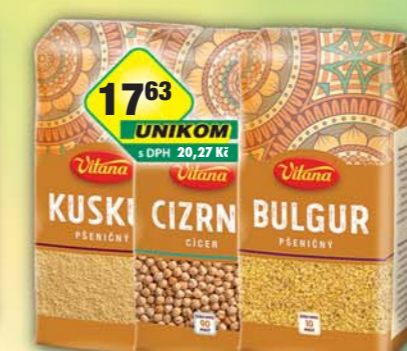
ORKLA FOODS ČR a SR a.s., Bulgur 430g, obj.č.25105010, Cizrna 410g, obj.č.24105030, Kuskus 390g, obj.č.25105030