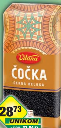
ORKLA FOODS ČR a SR a.s., Čočka beluga 450g, obj.č.24105095