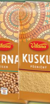
ORKLA FOODS ČR a SR a.s., Kuskus 390g, obj.č.25105030