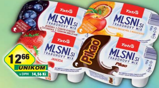
MLÉKÁRNA HLINSKO a.s., Tvaroh ochucený jahoda, obj.č.31122685, pikao, obj.č.31122686, borůvka&černý rybíz, obj.č.31122683, broskev&maracuja, obj.č.31122684, 133g