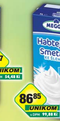
RAJO a.s., Smetana ke šlehání 30% 1l, obj.č.65221105