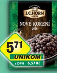
ORKLA FOODS ČR a SR a.s., Nové koření 15g, obj.č.22105692