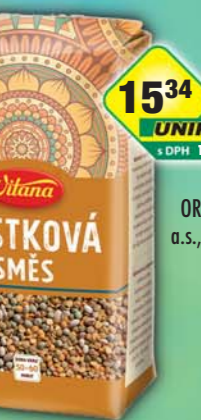
ORKLA FOODS ČR a SR a.s., Hrstková směs 445g, obj.č.24105137