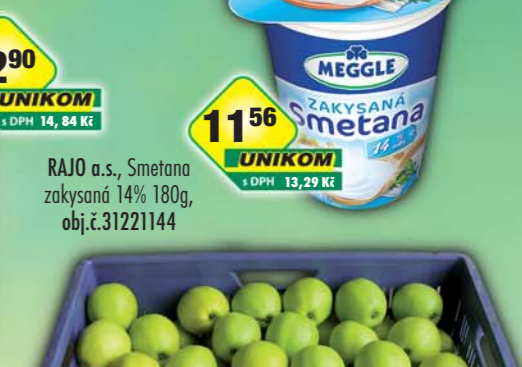
RAJO a.s., Smetana zakysaná 14% 180g, obj.č.31221144