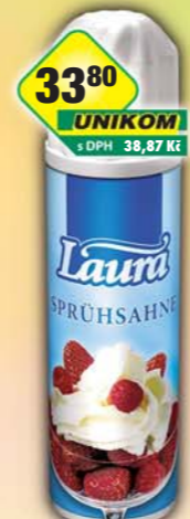
RAJO a.s., Šlehačka Laura spray 250ml, obj.č.31221215