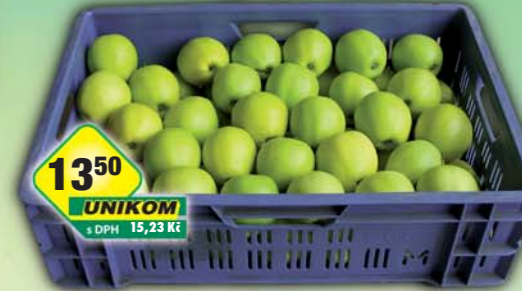
CZ FRUIT, odbytové družstvo, Jablka zelená 1kg, obj.č.68397300