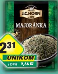
ORKLA FOODS ČR a SR a.s., Majoránka 4g, obj.č.22105305