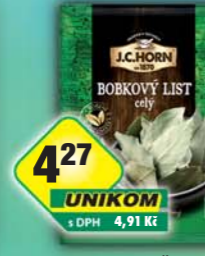
ORKLA FOODS ČR a SR a.s., Bobkový list 4g, obj.č.22105128