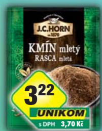
ORKLA FOODS ČR a SR a.s., Kmín mletý 18g, obj.č.22105274