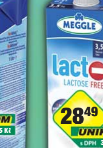
RAJO a.s., Mléko Lacto free 3,5% 1l, obj.č.31221931