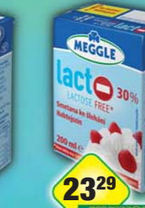
RAJO a.s., Smetana na šlehání bez laktózy 30% 200ml, obj.č.31221159