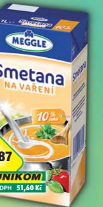
RAJO a.s., Smetana na vaření 10% 500ml, obj.č.31221164