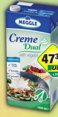
RAJO a.s., Smetana Creme Dual 25% 1l, obj.č.31708710