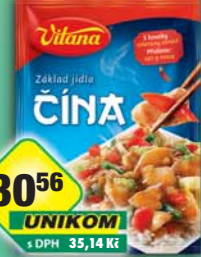
ORKLA FOODS ČR a SR a.s., Základní jídla Čína 97g, obj.č.30105960