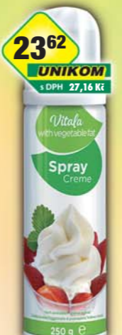
RAJO a.s., Šlehačka Vitana spray 250ml, obj.č.31221220