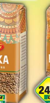
ORKLA FOODS ČR a SR a.s., Pohanka kroupa 425g, obj.č.25105090