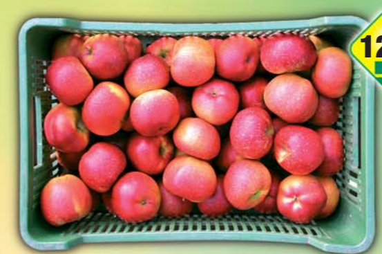
CZ FRUIT, odbytové družstvo, Jablka červená 1kg, obj.č.68397120