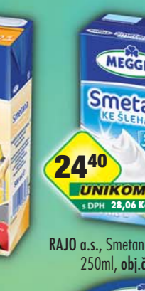
RAJO a.s., Smetana ke šlehání 30% 250ml, obj.č.31221161