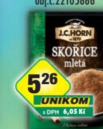
ORKLA FOODS ČR a SR a.s., Skořice mletá 20g, obj.č.22105514