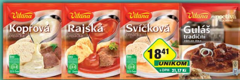
ORKLA FOODS ČR a SR a.s., Guláš tradiční 60g, obj.č.30105141, Koprová omáčka 83g, obj.č.30105516, Rajská omáčka 65g, obj.č.30105531, Svičková omáčka 75g, obj.č.30105536