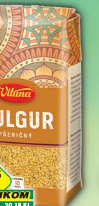
ORKLA FOODS ČR a SR a.s., Bulgur 430g, obj.č.25105010