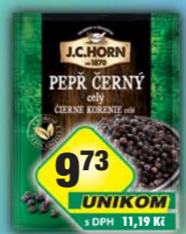
ORKLA FOODS ČR a SR a.s., Peprí černý celý 15g, obj.č.22105886