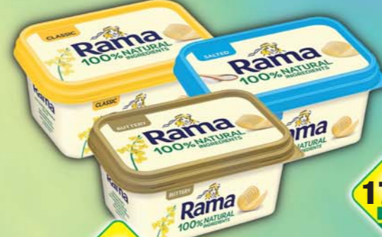
UPFIELD CR s.r.o., Rama classic, obj.č.33825805, máslová, obj.č.33825806, máslová slaná, obj.č.33825831, 400g