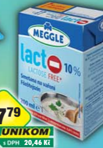
RAJO a.s., Smetana na vaření bez laktózy 10% 200ml, obj.č.31221160