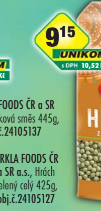
ORKLA FOODS ČR a SR a.s., Hrách zelený celý 425g, obj.č.24105127