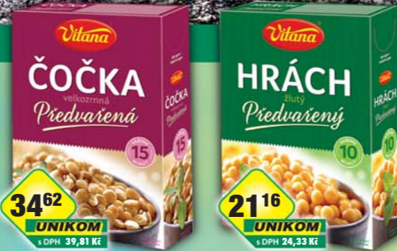
ORKLA FOODS ČR a SR a.s., Předvařená čočka 400g, obj.č.24105110, ORKLA FOODS ČR a SR a.s., Hrách žlutý předvařený 350g, obj.č.24105135