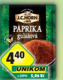
ORKLA FOODS ČR a SR a.s., Paprika gulášová 20g, obj.č.22105367