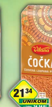
ORKLA FOODS ČR a SR a.s., Čočka červená 420g, obj.č.24105099