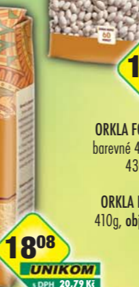
ORKLA FOODS ČR a SR a.s., Fazole barevné 400g, obj.č.24105120, bílé 430g, obj.č.24105123