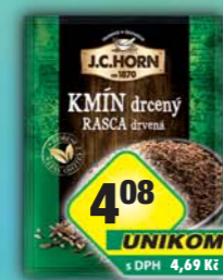
ORKLA FOODS ČR a SR a.s., Kmín drcený 20g, obj.č.22105874