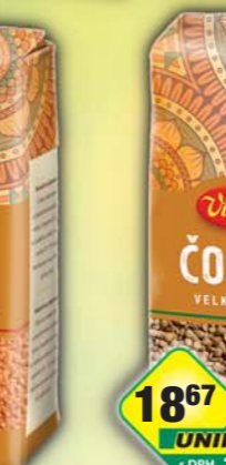
ORKLA FOODS ČR a SR a.s., Čočka velkozrná 425g, obj.č.24105111