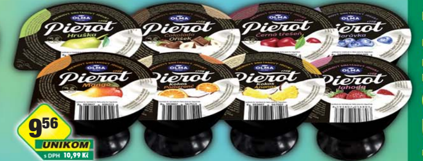
OLMA a.s., Pierot borůvky, obj.č.31697445, černá třešeň, obj.č.31697452, čoko/orech, obj.č.31697450, hruška, obj.č.31697453, jahoda, obj.č.31697455, kokos/ananas, obj.č.31697454, kokos/pomeranč, obj.č.31697456, mango, obj.č.31697459, 175g