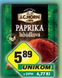
ORKLA FOODS ČR a SR a.s., Paprika lahůdková 20g, obj.č.22105881