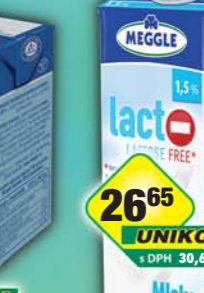
RAJO a.s., Mléko Lacto free 1,5% 1l, obj.č.31221930