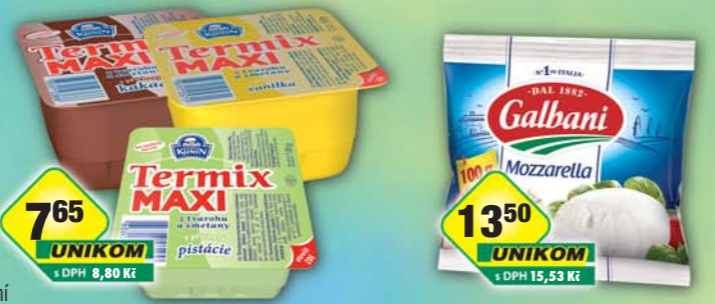
LACTALIS s.r.o., Termix kakao maxi, obj.č.31584741, pistácie maxi, obj.č.31584754, vanilka maxi, obj.č.31584753, 130g LACTALIS s.r.o., Sýr Mozzarella 100g, obj.č.31584669