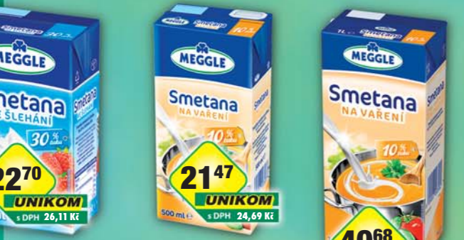
RAJO a.s., Smetana ke šlehání 30% 250ml, obj.č. 31221161 RAJO a.s., Smetana na vaření 10% 500ml, obj.č. 31221164