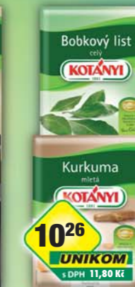
Johann Kotányi, Bobkový list 5g, obj.č.22137117, Kurkuma mletá 35g, obj.č.22137255