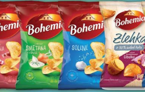
INTERSNACK a.s., Chips Bohemia paprika, obj.č.11309964, slanina, obj.č.11309965, smetana/cibulka, obj.č.11309966, sůl, obj.č.11309967, špiz, obj.č.11309968, 70g, zlehka cibulková, obj.č.11309109, zlehka solené, 65g, obj.č.11309108, Sticks Bohemia jemný kečup 70g, obj.č.11309844