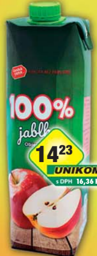
14 23 UNIKOM s DPH 16,36 Kč