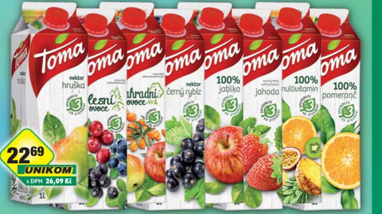
KMV BEV CZ s.r.o., Džus Toma černý rybíz, obj.č.47170129, hruška, obj.č.47170157, jablko 100%, obj.č.47170161, jahoda, obj.č.47170163, lesní ovoce, obj.č.47170164, multivitamin 100%, obj.č.47170165, pomeranč 100%, obj.č.47170169, zahradní ovoce, obj.č.47170176, 1l