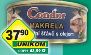
UNIKOM a.s., Makrela vlastní šťáva 240g, obj.č.43186100