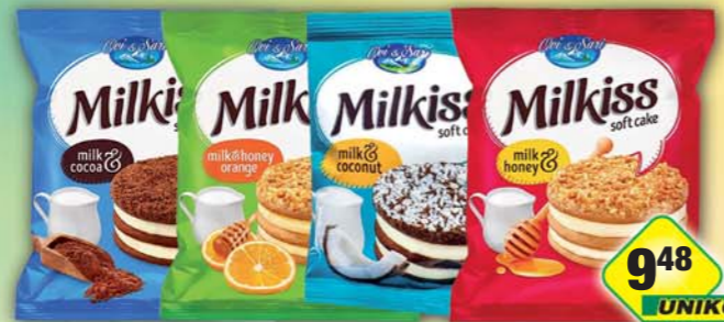
PALOMA PLUS s.r.o., Milkiss cake kakao, obj.č.14163471, kokos, obj.č.14163473, milk&honey, obj.č.14163470, pomeranč, obj.č.14163474, 50g