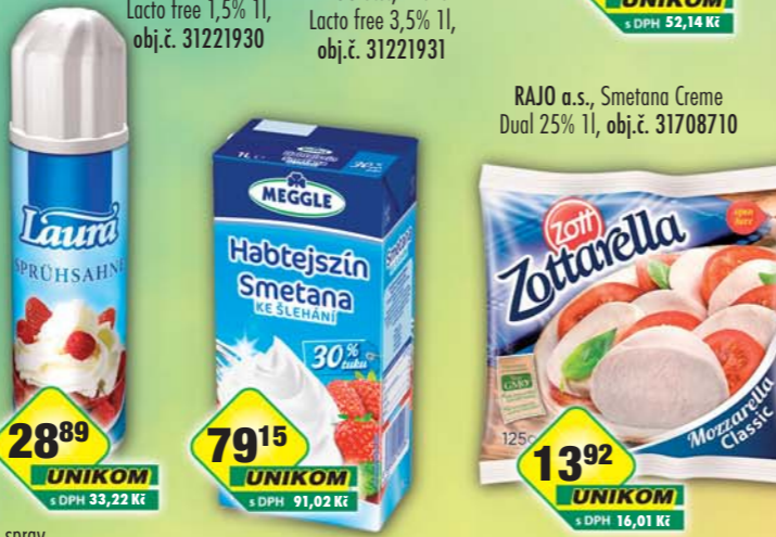
RAJO a.s., Smetana na vaření 10% 1l, obj.č. 65221104 RAJO a.s., Šlehačka Laura spray 250ml, obj.č. 31221215 RAJO a.s., Smetana ke šlehání 30% 1l, obj.č. 65221105