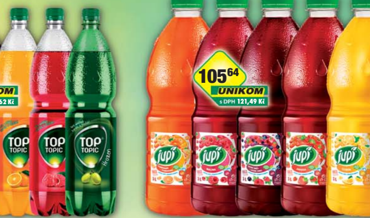
KOFOLA a.s., RC Colo, obj.č.45115294, Top Topic hrozen, obj.č.45115310, Top Topic malina, obj.č.45115855, Top Topic pomeranč, obj.č.45115870, 1,5l KOFOLA a.s., Sirup Jupí citron, obj.č.67115121, jahoda, obj.č.67115122, lesní směs, obj.č.67115123, malina, obj.č.67115127, pomeranč, obj.č.67115126, 3l