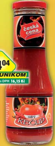
14 04 UNIKOM s DPH 16,15 Kč