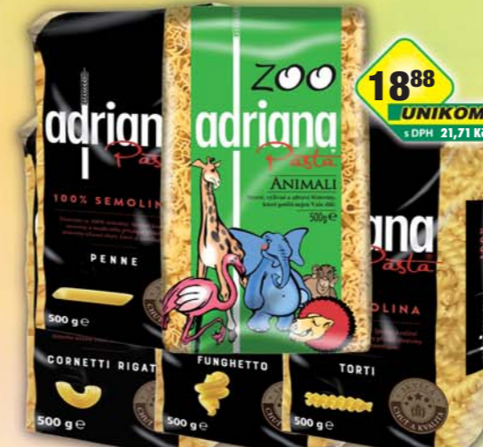
Europasta SE, Adriana semolina kolínka, obj.č.25146101, penne, obj.č.25146282, spirály, obj.č.25146311, vřetena, obj.č.25146376, ZOO zvířátka, obj.č.25146395, 500g