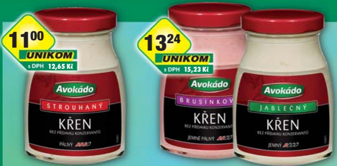
1100 UNIKOM s DPH 12,65 Kč 1324 UNIKOM s DPH 15,23 Kč PĚKNÝ - UNIMEX, Křen strouhaný 175g, obj.č.37151350 PĚKNÝ - UNIMEX, Křen brusinkový, obj.č.37151330, jablečný, obj.č.37151340, 175g