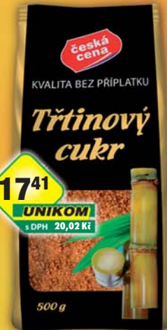
17 41 UNIKOM s DPH 20,02 Kč