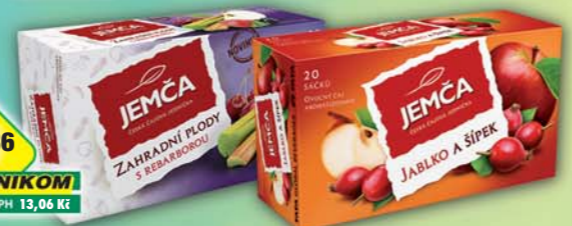
1136 UNIKOM s DPH 13,06 Kč JEMČA a.s., Čaj Jablko/šípek, obj.č.18109168, Zahradní plody s rebarborou, obj.č.18109968, 40g