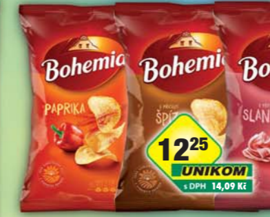
INTERSNACK a.s., Chips Bohemia paprika, obj.č.11309991, slanina, obj.č.11309976, solené, obj.č.11309992, 140g