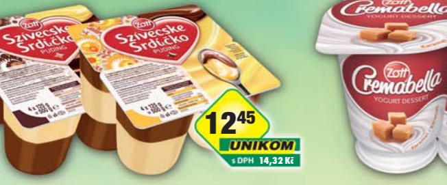
ZOTT s.r.o., Puding Srdčko čokoláda/vanilka, obj.č.31775830, vanilka/čokoláda, obj.č.31775832, 4x125g