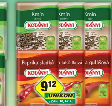
Johann Kotányi, Kmin celý 28g, obj.č.22137221, drcený 25g, obj.č.22137226, mletý 28g, obj.č.22137225, Paprika gulášová, obj.č.22137366, lahůdková, obj.č.22137368, sladká, obj.č.22137370, 25g