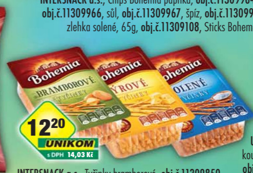
INTERSNACK a.s., Tyčinky bramborové, obj.č.11309850, slané, obj.č.11309884, sýrové, obj.č.11309890, 85g