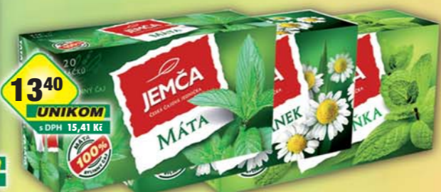
1340 UNIKOM s DPH 15,41 Kč JEMČA a.s., Čaj Heřmáněk 24g, obj.č.18109165, Mята 30g, obj.č.18109197, Meduňka 30g, obj.č.18109191