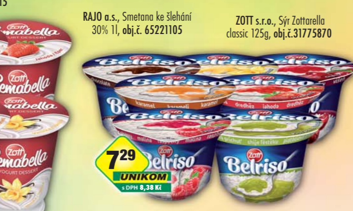
ZOTT s.r.o., Rýže mléčná Belriso classic, obj.č.31775841, delight, obj.č.31775839, special, obj.č.31775843, standard, obj.č.31775851, 200g