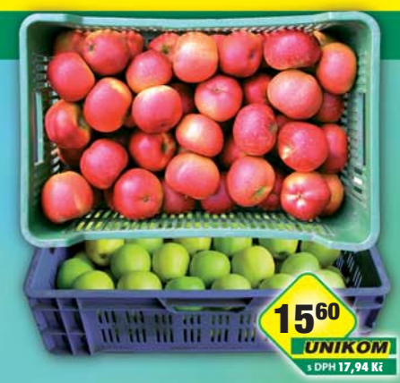
1560 UNIKOM s DPH 17,94 Kč CZ FRUIT, odbytové družstvo, Jablka červená 1.85+, obj.č.68397123, zelená II, obj.č.68397300, 1kg