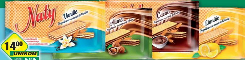
ŠAFRÁNEK JIŘÍ, Naty citronové, obj.č.10541200, kakaové, obj.č.10541220, ořechové, obj.č.10541235, vanilkové, obj.č.10541245, 160g