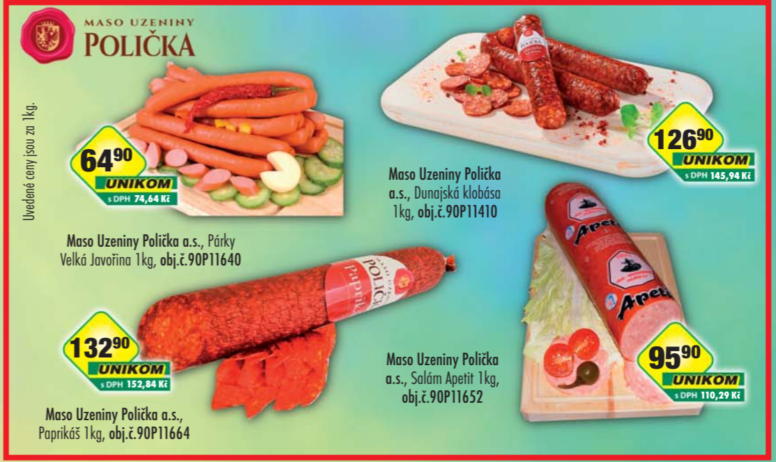
64 90 UNIKOM s DPH 74,64 Kč