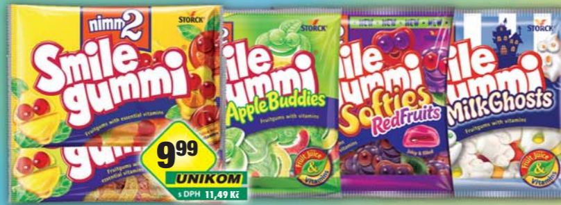
STORCK s.r.o., Nimm2 Smile Gummi apple, obj.č.14157150, fruits, obj.č.14157173, milk ghosts, obj.č.14157156, 90g, kyselá, obj.č.14157116, ovocná, obj.č.14157115, 100g