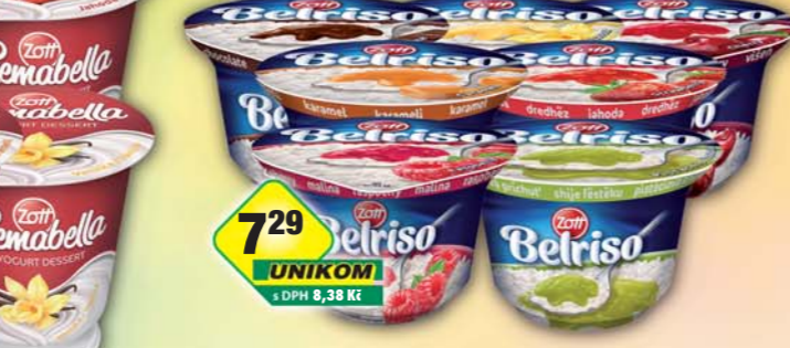
ZOTT s.r.o., Jogurt Cremabella mix 140g, obj.č. 31775160