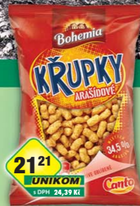
INTERSNACK a.s., Křupky arašidy 200g, obj.č.11306126