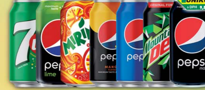
KMV BEV CZ s.r.o., 7UP, obj.č.45170257, Mirinda, obj.č.45170760, Mountain dew, obj.č.45170883, Pepsi, obj.č.45170123, guava, obj.č.48170250, original, obj.č.48170281, Pepsi Mango, obj.č.45170882, Pepsi MAX bez kalorií, obj.č.45170124, 0,33l