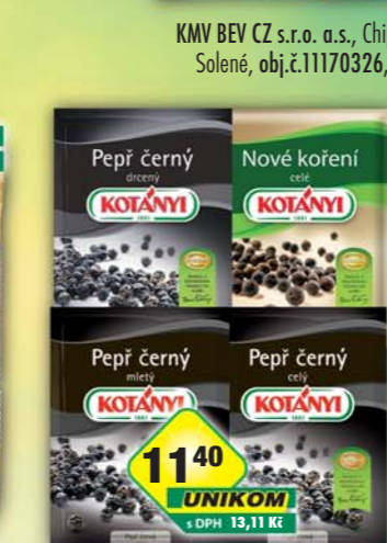
Johann Kotányi, Nové celé 15g, obj.č.22137348, Peří černý celý, obj.č.22137382, drcený, obj.č.22137400, mletý, obj.č.22137405, 20g