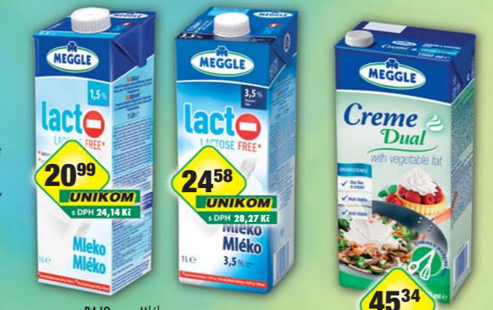
RAJO a.s., Mléko Lacto free 1,5% 1l, obj.č. 31221930 RAJO a.s., Mléko Lacto free 3,5% 1l, obj.č. 31221931 RAJO a.s., Smetana Creme Dual 25% 1l, obj.č. 31708710