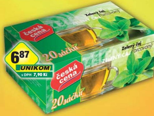
6 87 UNIKOM s DPH 7,90 Kč