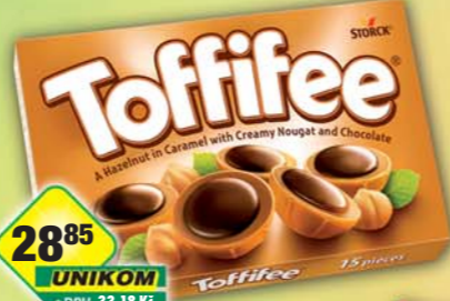
STORCK s.r.o., Toffifee 125g, obj.č.13157117