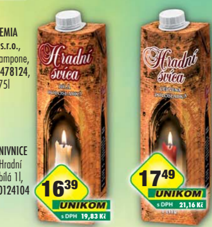
1639 UNIKOM s DPH 19,83 Kč 1749 UNIKOM s DPH 21,16 Kč LINEA NIVNICE a.s., Hradní svíca bílá 1l, obj.č.50124104