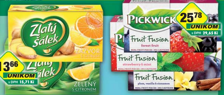
JACOBS DOUWE EGBERTS s.r.o., Čaj ZŠ zázvor 35g, obj.č.18108950, zelený s citronem 30g, obj.č.17108214 JACOBS DOUWE EGBERTS s.r.o., Čaj Pickwick jahoda&matá 35g, obj.č.18108829, lesní směs 35g, obj.č.18108832, Svestka s vanilkou 40g, obj.č.18108170