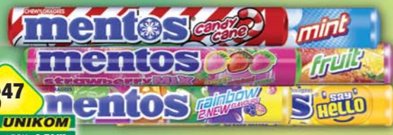
PERFETTI VAN MELLE s.r.o., Mentos Candy Cane, obj.č.14177159, Rainbow, obj.č.14177214, Say Hello lemonade, obj.č.14177981, Strawberry mix, obj.č.14177979, 37,5g, Fruit, obj.č.14177161, Mint, obj.č.14177201, 38g