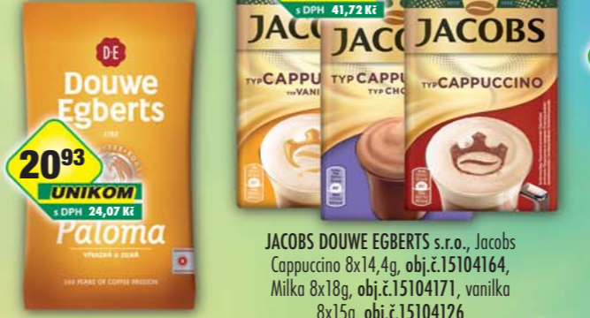
JACOBS DOUWE EGBERTS s.r.o., DE Paloma 100g, obj.č.15108122 JACOBS DOUWE EGBERTS s.r.o., Jacobs Cappuccino 8x14,4g, obj.č.15104164, Milka 8x18g, obj.č.15104171, vanilka 8x15g, obj.č.15104126