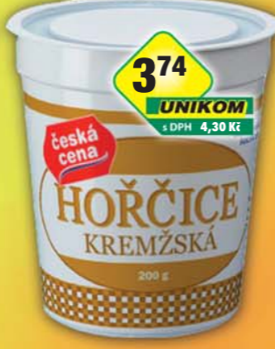
374 UNIKOM s DPH 4,30 Kč