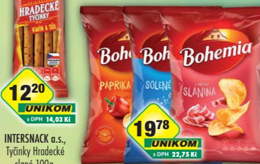
INTERSNACK a.s., Chips Bohemia paprika, obj.č.11309991, slanina, obj.č.11309976, solené, obj.č.11309992, 140g