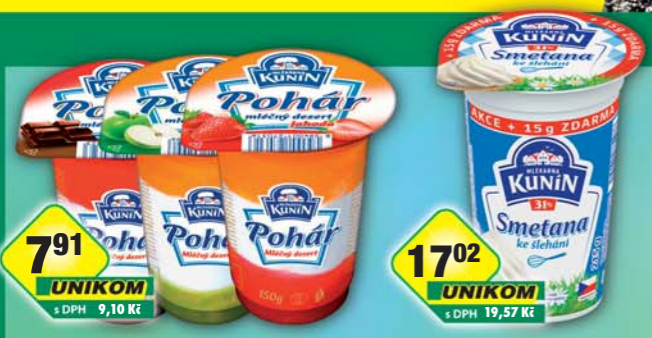
LACTALIS s.r.o., Pohár smetanový čokoláda, obj.č.31584236, jablko, obj.č.31584238, jahoda, obj.č.31584240, 150g LACTALIS s.r.o., Smetana ke šlehání 31% 215g, obj.č.31584579