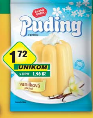
ČESKÁ CENA, Puding vanilka 38g, obj.č.27628451