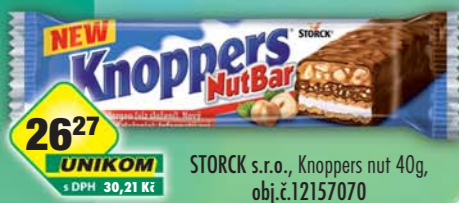
STORCK s.r.o., Knoppers nut 40g, obj.č.12157070