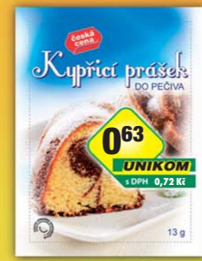
063 UNIKOM s DPH 0,72 Kč