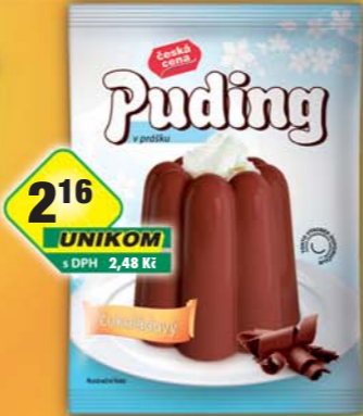
216 UNIKOM s DPH 2,48 Kč