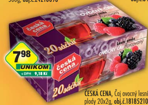
7 98 UNIKOM s DPH 9,18 Kč