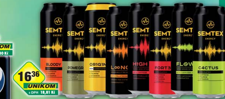
KOFOLA a.s., Semtex cactus, obj.č.48549563, flow, obj.č.48115496, forte, obj.č.48549555, granátové jablko, obj.č.48549569, high, obj.č.48115497, krvavý pomeranč, obj.č.48549520, long, obj.č.48115498, original, obj.č.48549552, 500ml