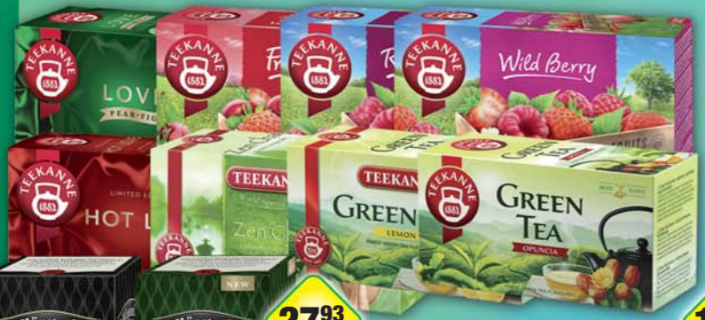
2793 UNIKOM s DPH 32,12 Kč PĚKNÝ - UNIMEX, Čaj Hot Love 40g, obj.č.18424082, Love Pear&Fig 40g, obj.č.18424247, SW Earl Grey 35g, obj.č.17424050, SW Green tea orange 35g, obj.č.17424058, WOF Fruit Kiss 50g, obj.č.18424173, WOF Raspberry 50g, obj.č.18424189, WOF Wild Berry 40g, obj.č.18424278, Zelený s citronem 35g, obj.č.17424141, Zelený s opuncí 35g, obj.č.17424151, Zen Chai 35g, obj.č.18424201