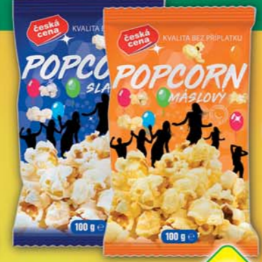
ČESKÁ CENA, Popcorn maslový, obj.č.11169290, slaný, obj.č.11169293, 100g