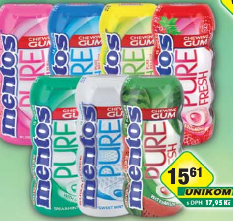
PERFETTI VAN MELLE s.r.o., Mentos gum PF Bubble fresh, obj.č.14177984, Fresh mint, obj.č.14177989, Fruit lemon, obj.č.14177980, Fruit strawberry, obj.č.14177178, Spearmint, obj.č.14177988, Watermelon, obj.č.14177974, PW Sweet mint, obj.č.14177973, 30g