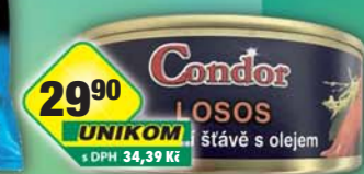
UNIKOM a.s., Losos ve vlastní šťávě 240g, obj.č.43186080