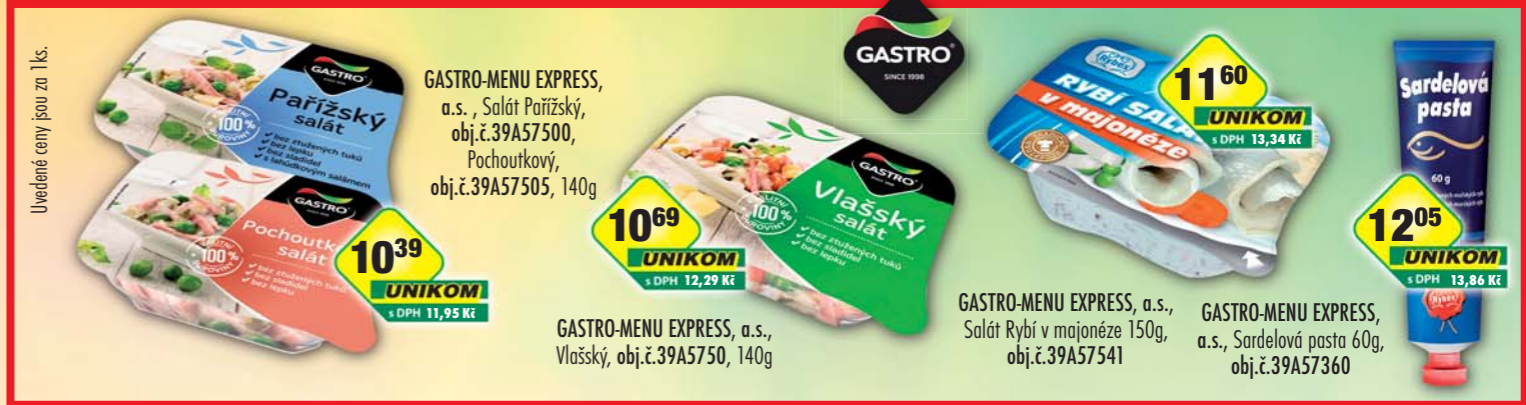
Uvedené ceny jsou za 1ks.