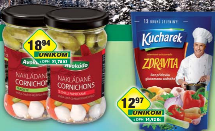
1894 UNIKOM s DPH 21,78 Kč 1297 UNIKOM s DPH 14,92 Kč PĚKNÝ - UNIMEX, Cornichons okurky s chilli, obj.č.35151050, tradiční, obj.č.35151053, 300g PĚKNÝ - UNIMEX, Zdravita sypké dochucovadlo 200g, obj.č.22200137