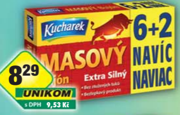
829 UNIKOM s DPH 9,53 Kč PĚKNÝ - UNIMEX, Bujón masový extra silný 6+2 88g, obj.č.28151206