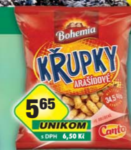
INTERSNACK a.s., Křupky arašidy 50g, obj.č.11306128