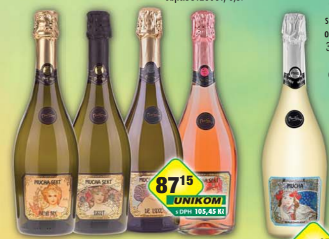
8715 UNIKOM s DPH 105,45 Kč 8715 UNIKOM s DPH 100,22 Kč SOARE a.s., Sekt Mucha brut, obj.č.52138175, de Luxe, obj.č.52138252, demi, obj.č.52138182, rosé, obj.č.52138173, 0,75l