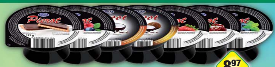
897 UNIKOM s DPH 10,32 Kč 11084 UNIKOM s DPH 134,12 Kč OLMA a.s., Pierot borůvky, obj.č.31697445, černá třešeň, obj.č.31697452, jahoda, obj.č.31697455, kokos-ananas, obj.č.31697454, kokos-pomeranč, obj.č.31697456, lesní směs, obj.č.31697458, s kakaovými sušenkami, obj.č.31697471, 175g