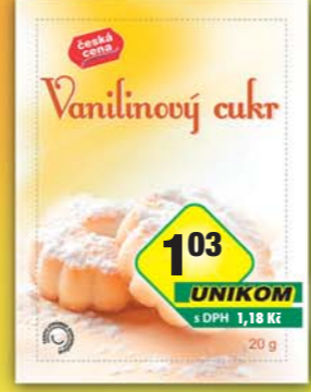
103 UNIKOM s DPH 1,18 Kč