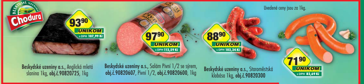
93 90 UNIKOM s DPH 107,99 Kč