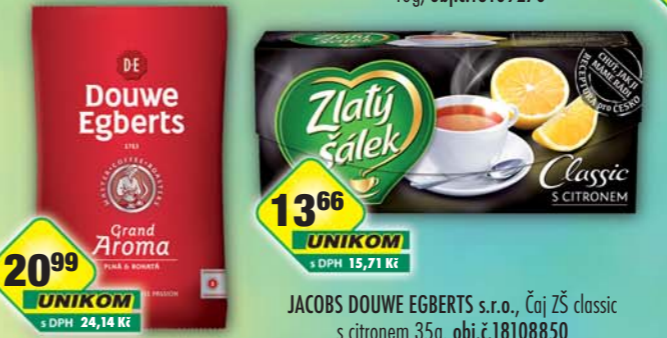
JACOBS DOUWE EGBERTS s.r.o., DE Grand Aroma 100g, obj.č.15108112 JACOBS DOUWE EGBERTS s.r.o., Čaj ZŠ classic s citronem 35g, obj.č.18108850