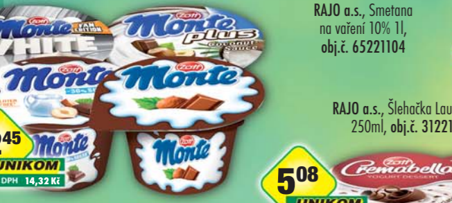
ZOTT s.r.o., Monte -30% cukru, obj.č.31775113, kokos, obj.č.31775126, Monte, obj.č.31775123, white, obj.č.31775598, 150g