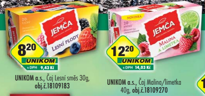
UNIKOM a.s., Čaj Lesní směs 30g, obj.č.18109183 UNIKOM a.s., Čaj Malina/limetka 40g, obj.č.18109270