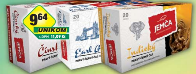
964 UNIKOM s DPH 11,09 Kč JEMČA a.s., Čaj Čínský, obj.č.17109121, Earl Grey, obj.č.17109109, Indický, obj.č.17109137, 30g