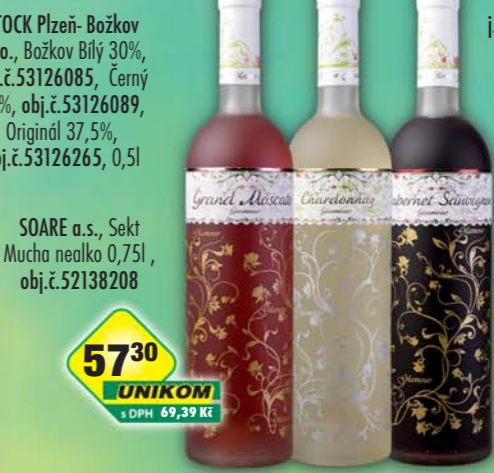
5730 UNIKOM s DPH 69,39 Kč 8715 UNIKOM s DPH 100,22 Kč SOARE a.s., Sekt Mucha nealko 0,75l, obj.č.52138208 GIV CZ s.r.o., Cabernet Sauvignon, obj.č.51391118, Chardonnay, obj.č.50391107, Moscato rosé, obj.č.51391560, 0,75l