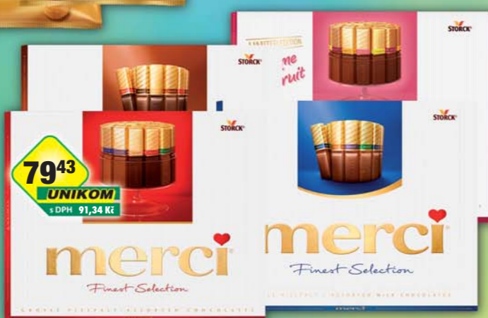
STORCK s.r.o., Merci creme fruit, obj.č.13157066, hořká, obj.č.13157101, klasik, obj.č.13157102, mléčná, obj.č.13157104, 250g