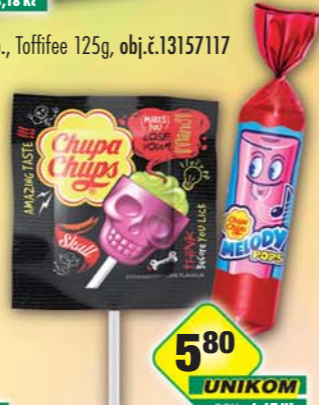
PERFETTI VAN MELLE s.r.o., Chuppa Chups lizárko Melody Pops, obj.č.14177238, Skull strawberry/lime, obj.č.14177209, 15g