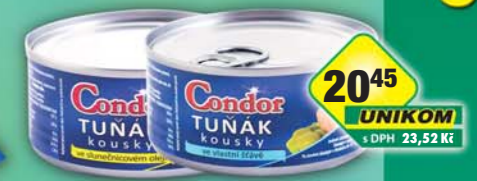
UNIKOM a.s., Tuňák kousky slunečnicový olej, obj.č.43186580, vlastní šťáva, obj.č.43186600, 170g