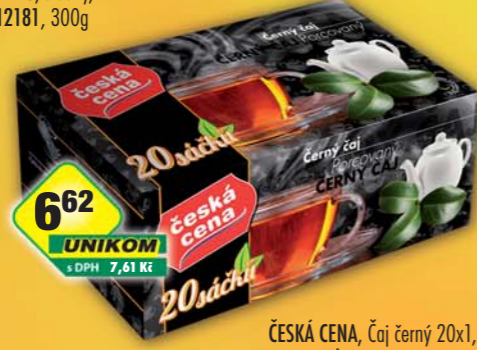
6 62 UNIKOM s DPH 7,61 Kč