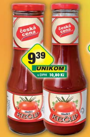
9 39 UNIKOM s DPH 10,80 Kč