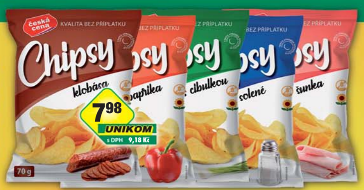
ČESKÁ CENA, Chips klobása, obj.č.11169164, paprikové, obj.č.11169169, smetana & cibule, obj.č.11169172, solené, obj.č.11169170, šunkové, obj.č.11169171, 70g