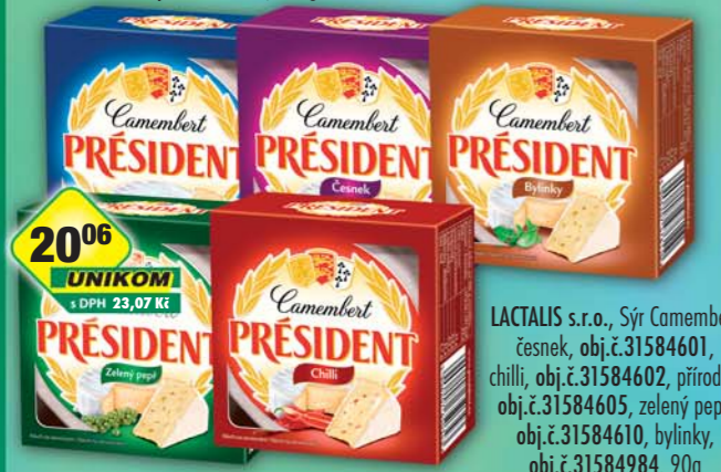
LACTALIS s.r.o., Sýr Camembert česnek, obj.č.31584601, chilli, obj.č.31584602, přírodní, obj.č.31584605, zelený pepí, obj.č.31584610, bylinky, obj.č.31584984, 90g