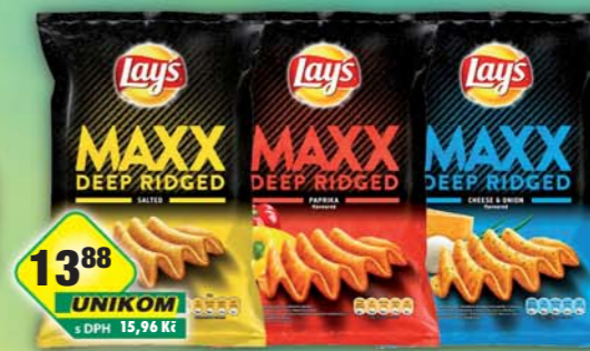
KMV BEV CZ s.r.o. a.s., Chips Lays Maxx Paprika, obj.č.11170324, Solené, obj.č.11170326, Sýr a cibulka, obj.č.11170322, 65g