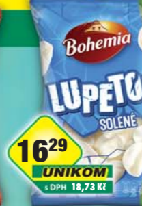
INTERSNACK a.s., Cracker Lupeto, obj.č.11309296, Mixér, obj.č.11309294, Šunkáč, obj.č.11309298, 75g