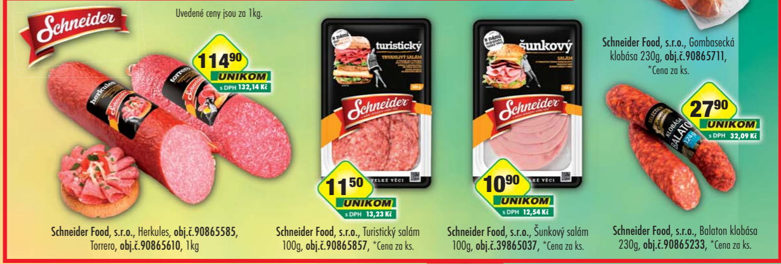
114 90 UNIKOM s DPH 132,14 Kč