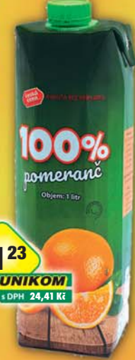
21 23 UNIKOM s DPH 24,41 Kč