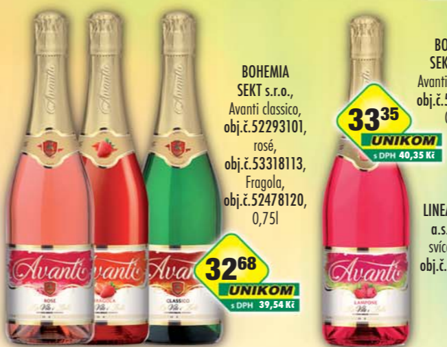
3268 UNIKOM s DPH 39,54 Kč 6890 UNIKOM s DPH 83,37 Kč LINEA NIVNICE a.s., Hradní svíca bílá 1l, obj.č.50124104