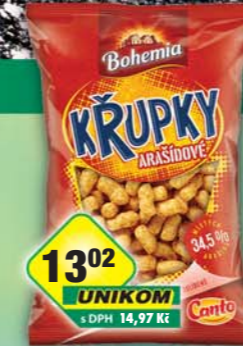
INTERSNACK a.s., Křupky arašidy 100g, obj.č.11306125