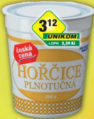
312 UNIKOM s DPH 3,59 Kč