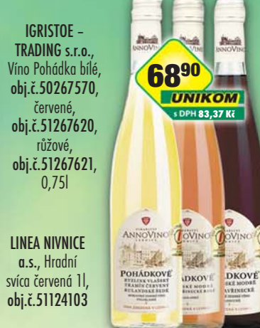
6890 UNIKOM s DPH 83,37 Kč IGRISTOE - TRADING s.r.o., Vino Pohádka bílé, obj.č.50267570, červené, obj.č.51267620, růžové, obj.č.51267621, 0,75l