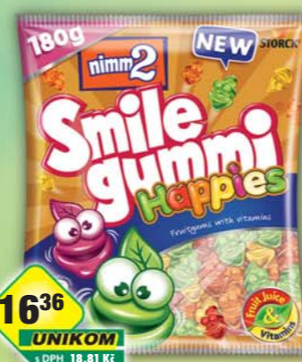
STORCK s.r.o., Nimm2 Smile Gummi happies 180g, obj.č.14157112