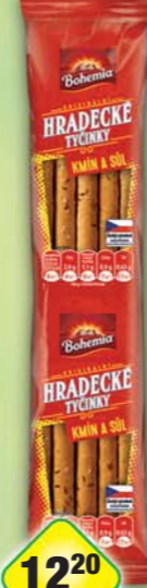
INTERSNACK a.s., Tyčinky Hradecké slané 100g, obj.č.11306149