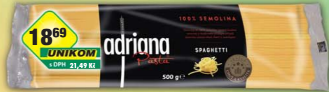
Europasta SE, Adriana semolina špagety 500g, obj.č.25146357